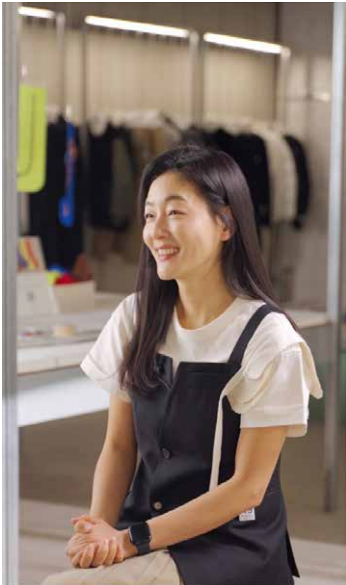
▲배우이자 환경운동가 박진희가 첫 글로벌 순환 패션 인터뷰를 진행하고 있는 모습

특히 이번 패션 임팩트 챌린지는 순환 패션 개념의 이해부터 실질적인 소비자의 행동 변화까지 이끌어낼 수 있도록 국내외 전문가들과 함께하는 ‘글로벌 순환 패션 인터뷰’, 코오롱FnC의 ‘서큘러 브랜드 고객 경험 프로그램’, 그리고 인스타그램 중심의 소비자 참여 이벤트 등