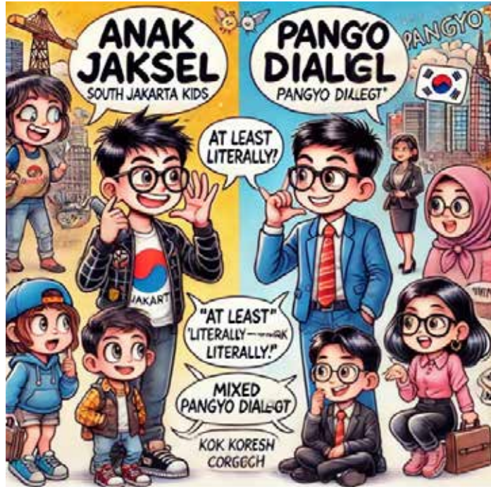
▲ 관련 이미지

판교 지역에는 IT 기업과 스타트업이 모여 있는 곳이다. 이곳에서 사용하는 '판교 사투리'는 오랜 전통의 방언이 아니라, 현대 비즈니스 환경에서 탄생한 언어다. 판교 주민들은 기본적으로 서울식 표준어를 사용하지만, 빠른 회의와 프레젠테이션 같은 상황