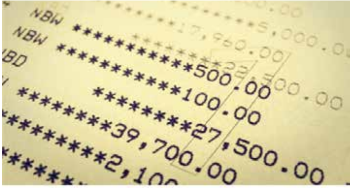
▲은행 통장 이미지

인도네시아 프라보워 수비안 또 대통령은 오는 8월 중순 통합 정부서비스 플랫폼인 고브테크(GovTech)를 구현하기 위해 모든 인도네시아 국민이 은행 계좌를 갖도록 보장하라고 보좌관들에게 지시했다. 국가경제위원회(DEN) 위원장 루훗 뻬자이판은 지난 20일 기자회견을 통해 인도네시아의 모든 가구가 은행계좌를 소유하는 것이 고브테크(GovTech)에서 중요한 역할을 할 것이며, 이는 사회지원금 지급을 위한 기반을 마련할 것이라고 말했다. 2026년 1월에 목표를 달성하기 위해 직접적인 사회 원조로 고브테크 테스트를 시작할 예정이라는 것이다. 루훗은 프라보워 대통령이 올해 8월 17일 인도네시아 독립기념일에 고브테크를 출시할 계획이며, 여러 정부 기관에 걸쳐 애플리케이션을 통합하여 효율성을 개선하고 부패의 기회를 줄이는 것 등이 고브테크의 이점이라고 말했다. 이 계획을 통해 국가예산에서 최대 100조 루피아를 절감할 수 있으며, 장기적으로 이 수치는 더 늘어날 것으로 그는 예상했다.