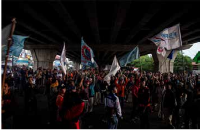
▲2023년 11월 브카시 노동자드의 임금 인상 요구 시위

인도네시아 노동조합은 소비력 약화, 공급망 문제, 사업 경쟁력 부족으로 인해 벌어지는 제조업 부문 전반에 걸친 해고에 대해 경고했다. 인도네시아 노동조합연맹(이하 KSPI)이 수집하여 지난 16일에 공개한 자료에서 노조 지역지부의 보고에 따르면, 올해 첫 두 달 동안 50개 노조 소속 기업에서 약 6만 명의 근로자가 일자리를 잃은 것으로 나타났다. KSPI의 사이트 이크발 회장은 지난 17일 자카르타포스트와의 인터뷰에서, 해고는 파산, 규모 축소 또는 이전으로 인한 것이며, 이 수치가 7월에는 “최대 15만 명”에 달할 수 있다고 말했다. 그는 해고의 주요 요인으로 정부 정책 요인, 높은 소비세 및 물류 비용과 함께 때때로 불확실한 세금을 언급하며 노동자들만 탓하지 말라고 덧붙였다. 첫 두 달 동안에만 약 6만 명이 해고된 것은 지난해 전체 해고 건수와 비슷하다며 엄청난 규모라고 덧붙였다. 인력부 통계에 따르면 전체 해고 인원은 2023년 64,855명, 2022년 25,114명에서 2024년