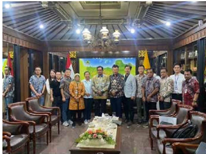
▲중부자와 한인회와 기업들은 지방정부를 찾아 2025년 최저임금 인상을 협상하고 있다.

업종별 최저임금 11.3%에서 2.5%로 타결, 한인회-지자체 협력의 새로운 성과