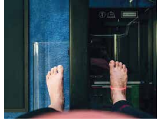
▲HP에 의해 운영되는 피트스테이션(FitStation)은 제네시스 맞춤형 기술의 핵심 역할을 한다.