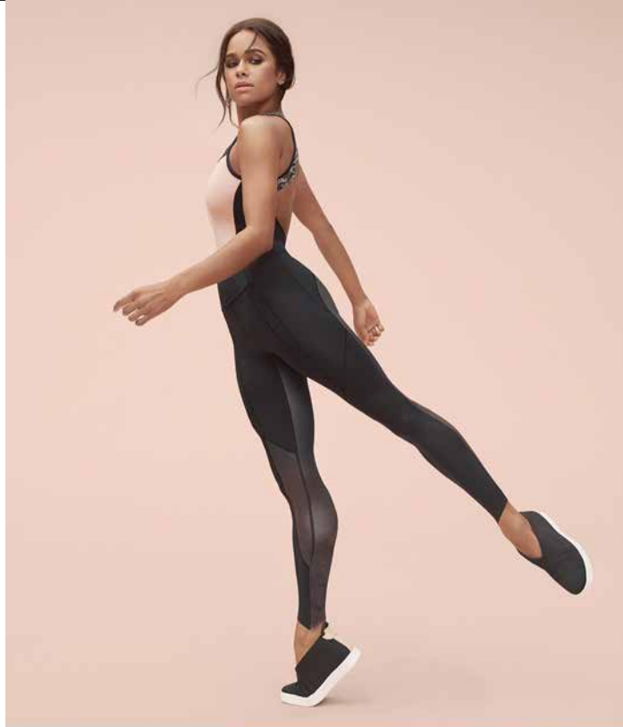
▲Under Armour에서 출시한 Misty Copeland의 시그니처 컬렉션

를 자주 사용하지 않는다. 우리에게 스포츠는 라이프스타일,” 이라고 Sportstyle의 크리에이티브 디렉터 Heiko Desens는 말했다. “요즘 소비자의 활발한 일상에는 변천하는 제품이 필요하다.