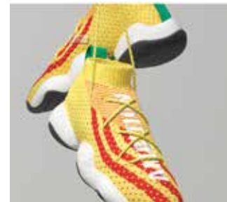
▲Pharrell x Adidas의 Crazy BYW PW

1990년대 Adidas의 기능성 농구화 FYW를 참고한 BYW는 스트리트 스타일과 문화를 되돌리는 것을 목표로 설계되었다고 Adidas Originals의 디자인 디렉터 Christopher Law는 말했다.