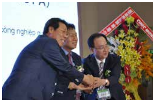
▲ 3개국 한국 신발협업회의의 회장의 MOU 체결이후 함께 가지는 화합을 위한 기념촬영.