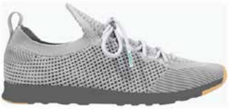
▲Native의 AP Mercury Liteknit

자인은 헤리티지 모델보다 인기가 높을 것으로 보인다. 브랜드와 시장 전문가들은 소비자들이 기술에 영향을 미치는 하이브리드 스니커즈 스타일을 원한다고 말하며 종일 신을 수 있는 편안한 기능성 신발을 설계하고 있다.