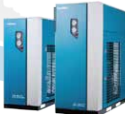
AD-HT 시리즈 (인버터 드라이버)

에프터 쿨러, 에어필터, 에어 드라이버 일체형으로 설치면적 최소화, 입구온도 80°C 설계로 더운 동남아 지역에 최적화.