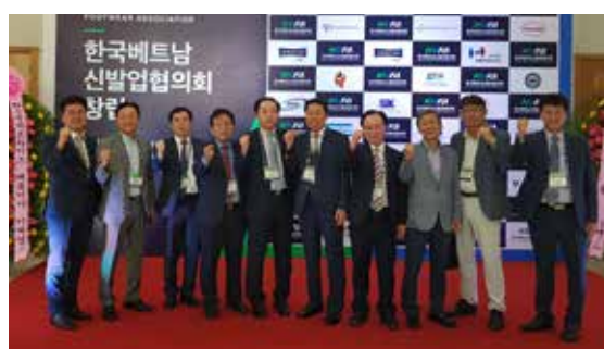
▲ 베트남 한국 신발협의회 창립기회를 위해 재인도네시아 한국 신발협의회, 한국 신발협의회, 한국 신발진흥센터, 부산시 관계자들의 기념촬영.