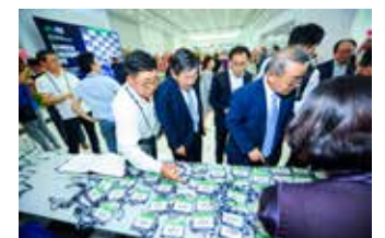
▲ 베트남 신발협회 창립 행사장의 많은 참석자가 등록을 하고있다

이로써 한국, 인도네시아, 베트남 3개국의 신 삼국시대가 열려 세상의 중심에서 한국 신발인의 기업을 토해내길 바란다.