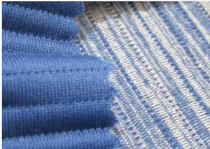
▲ Pontetorto의 나일론/폴리 합성 소재는 계절의 컬러와 촉감 대비에 집중한다.