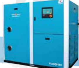
GRH 시리즈 (오일 인젝션 콤프레셔)

에프터 쿨러, 에어필터, 에어 드라이버 일체형으로 설치면적 최소화, 입구온도 80°C 설계로 더운 동남아 지역에 최적화.