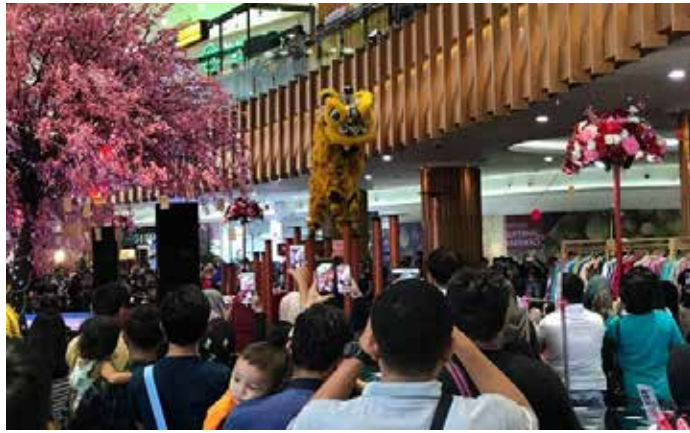
▲ 자카르타 외곽의 한 쇼핑몰에서 중국계 인도네시아인들의 설날인 임렉(imlek)에 즈음해 사자춤 공연을 하고 있다.

인은 고용 주체나 직위와 무관하게 별도의 취업허가를 받아야 하는데, 현지 교육기관에서 6개월 이상 수업을 받고