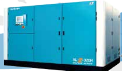
AL/CDH 시리즈 (오일프리 콤프레셔)

완벽한 오일 차단, 최장의 운전시간 보장, 최고의 오일프리 스크류 사용 AL 시리즈 : Kobelco(일본) CDH 시리즈 : GHH-RAND(독일)