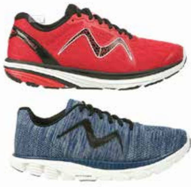
▲MBT의 러닝화 계열은 잘 알려진 로커 기술을 포함한다.

소매가격은 130달러이다. 지이이18(ZEE 18)은 최대 지지력을 겸비한 폭신한 느낌의 신