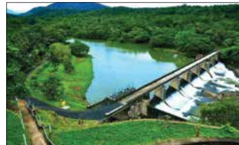
라노야브 수력발전소 (IPP추진중)