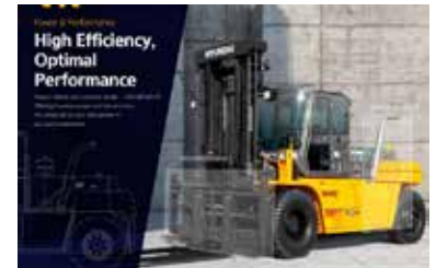
Hyundai 160D-7E 용량 : 600mm 로드 센터에서 16Ton 엔진 : 현대 HE6.7 디젤 엔진, 142KW/2200RPM 최대포크높이 : 3m(2단 프리뷰 마스트 포함) 포크 길이 : 1.2m 타이어 : 공압식 프론트 타이어 스티어링 : 유압 파워 스티어링 전송 : 토크플로우 전송