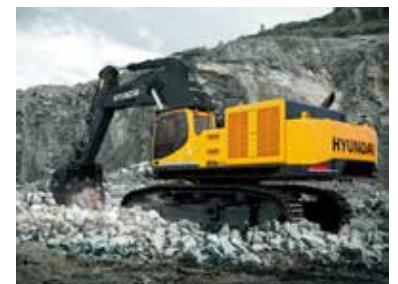
Excavator R850LC-9 작동 무게 : 84 ton 버킷 용량 : 5.2 m 3 정격 전력 : 510hp/1800rpm