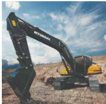
Excavator HX340SL 작동 무게 : 33 ton 버킷 용량 : 2.3 m 3 정격 전력 : 260hp/2,200rpm