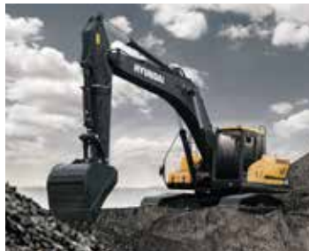
Excavator HX210S 작동 무게 : 20.83 ton 버킷 용량 : 0.92 m 3 정격 전력 : 148hp/2000rpm