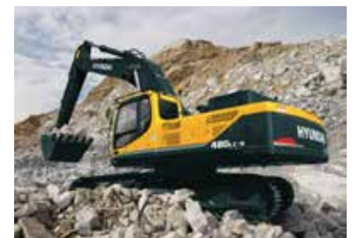
Excavator R480LC-9S 작동 무게 : 49.5 ton 버킷 용량 : 3.2 m 3 정격 전력 : 353hp/1900rpm