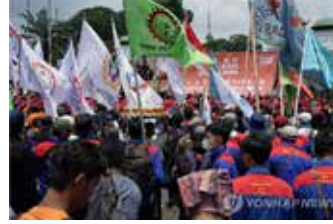
▲인도네시아 휘발유 가격 인상 반대 시위

인도네시아 정부가 재정 압박을 견디지 못하고 휘발유 가격을 올리자 대중교통 요금 역시 줄줄이 오르는 등 연쇄 파장이 이어지고 있다.