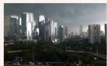
▲자카르타 수디르만 상업지구(SCBD)

30일 자카르타포스트에 따르면, 무디스 애널리틱스의 가브리엘 테이(Gabriel Tay)는 29일 논평에서 정상적인 상황에서 적자 상한선을 복원하기로 하는 것은 신중한 재정 관리일 수 있다. 그러나 몇 년 만에 가장 높은 인플레이션 속에 글로벌 경기 둔화와 거시경제 불확실성이 큰 상황에서 재정적자 상한선의 복원은 시기상조라고 말했다. 인도네시아는 2022년 상반기 6개월 간의 예산 흑자로 신흥국과 개도국 모두에서 두각을 나타냈지만 전문가들은 이런 추세가 올해 남은 기간까지 지속되지 못할 것으로 예상