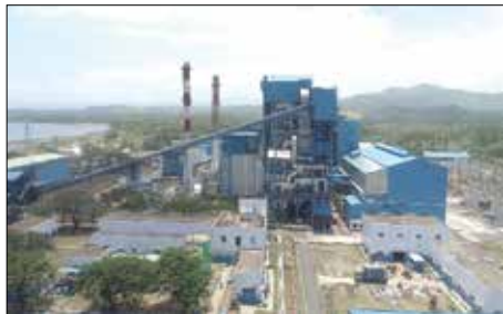
아무랑 화력발전소 (보유지분98%, EPC수행)

또한 인도네시아 에너지 IPP사업에도 진출하여 자체 화력발전소 1기 시공/운영 및 전력판매 중이며, 친환경 에너지 수력 및 태양광 사업에도 지속 투자하며 에너지 사업의 Developer 로 거듭나고 있습니다.