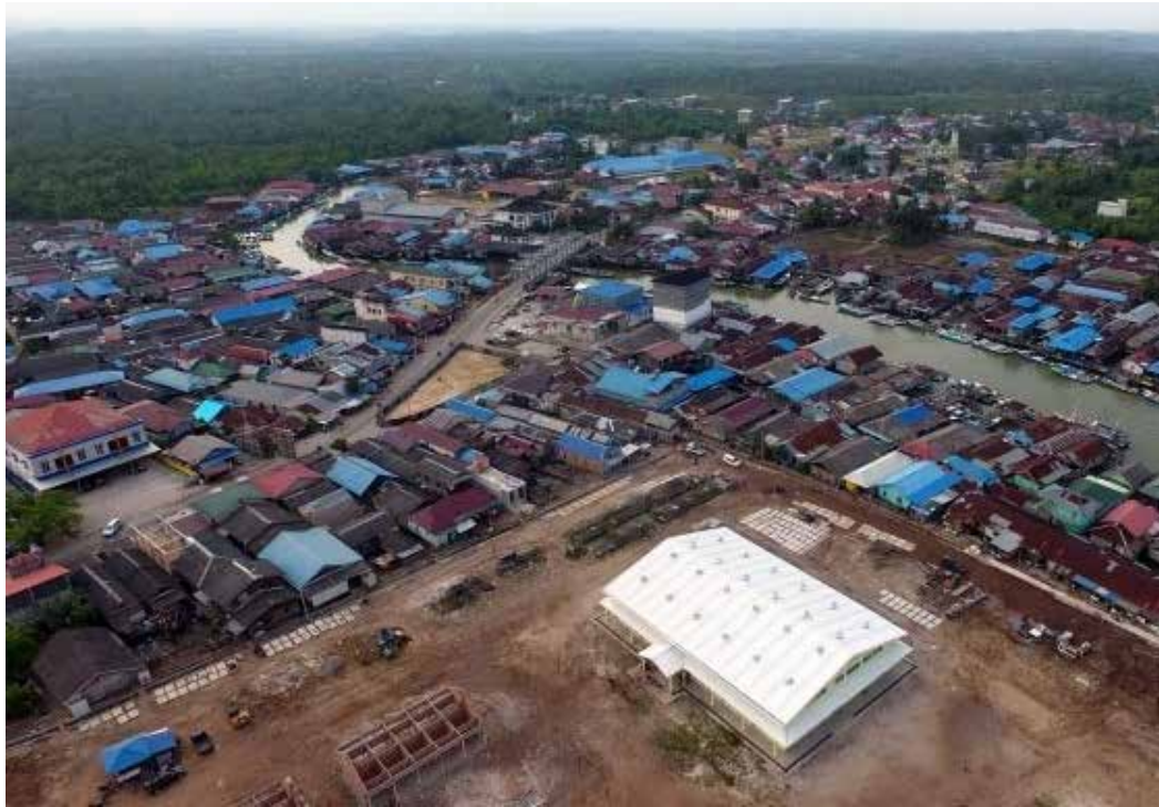
▲인도네시아 신수도가 들어설 보르네오섬 동칼리만탄 지역의 삼보자쿠알라 마을 모습. 사진=트리뷴뉴스

예정이다. 코로나 이전에 이 프로젝트는 토니 블레어 전 영국 총리와 같은 인물들의 관심을 끌었다. 셰이크 모하메드 빈 자이드 UAE 대통령, 손정의 소프트뱅크 회장 등도 투자에 참여하려고 했다.