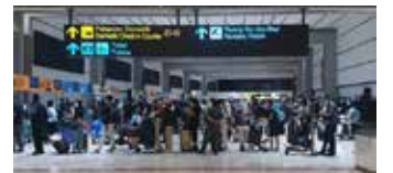
▲수카르노하타 공항 국내선