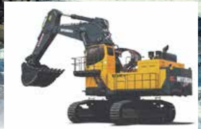
Excavator R1250-9 작동 무게 : 125 ton 버킷 용량 : 7.0 m 3 정격 전력 : 760hp/1800rpm