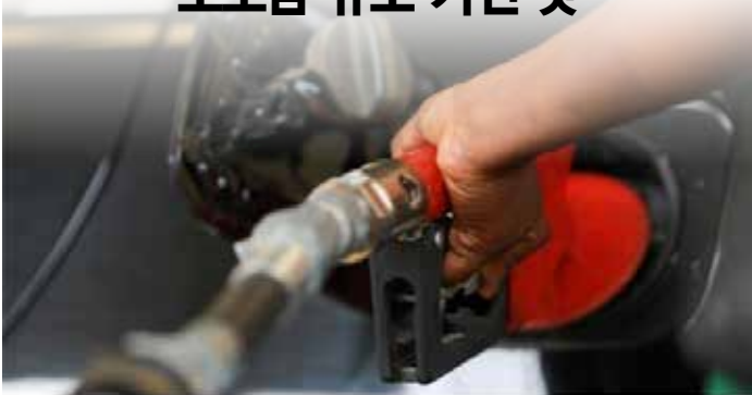
▲인도네시아 정부가 가격을 낮췄던 ‘반값 휘발유’ 가격을 다시 31% 올렸다.

인도네시아 정부가 막대한 보조금을 써가며 가격을 낮췄던 ‘반값 휘발유’ 가격을 다시 31% 올렸다. 4일(현지시간) 외신에 따르면 아리핀 타스리프 인도네시아 에너지광물자원부 장관은 3일 오후부터 ‘페르타라이트’ 휘발유의 가격을 리터 당 7650 루피아(약 700원)에서 1만 루피아(약 915원)로 올린다고 밝혔다. 보조금을 지원받는 디젤유 역시 리터 당 5150 루피아(약 471원)에서 6800 루피아(약 622원)로 인상됐다. 보조금 지원은 없지만, 국영 에너지회사 페르타미나가 판매해 상대적으로 가격이 저렴한 ‘페르타맥스’도 리터 당 1만2500 루피아(약 1144원)에서 1만4500 루피아(약 1327원)로 조정됐다. 조코 위도도 인도네시아 대통령은 “연료 가격을 유지하고 싶었지만, 보조금 예산이 당초 예상보다 3배나 늘었기 때문에 부득이 연료 가격을 인상했다”고 설명했다. 인도네시아 정부가 이번에 가격을 올린 페르타라이트는 옥탄가가 90인 저가형 휘발유다. 옥탄가가 낮아 그만큼 품질은 떨어지지만 다른 휘발유