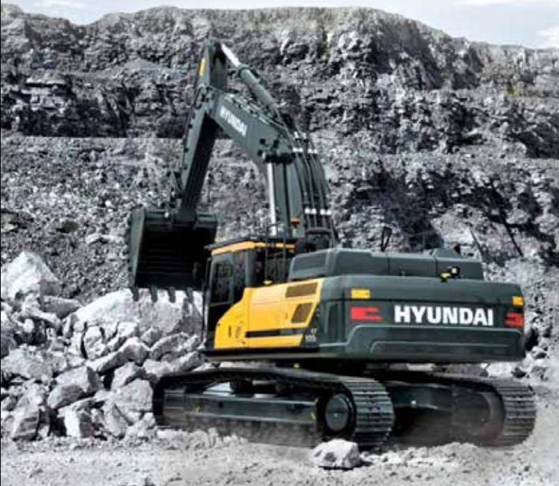
Excavator Hyundai HX500L 작동 중량 : 246 kW 330hp / 2100rpm 버킷 용량 : 3.6m