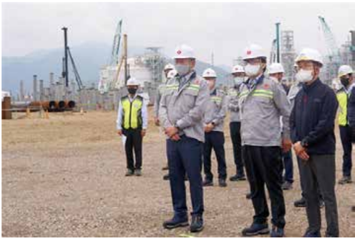
▲신동빈 롯데 회장(앞줄 오른쪽 셋째)이 지난 8월 29일 해외 투자 중 최대 규모인 인도네시아 ‘라인 프로젝트’ 현장을 직접 방문해 프로젝트 진척 상황을 점검하고 있다.

신동빈 롯데그룹 회장이 특별 사면 이후 첫 해외 출장지로 인도네시아와 베트남을 잇달아 방문하며 동남아 지역 사업의 큰 그림을 그리고 있다. 이번 해외 현장 경영에서 신동빈 회장은 막대한 투자가 진행 중인 인도네시아 석유화학단지과 베트남 스마트단지 조성 등 양국의 랜드마크가 될 초대형 프로젝트를 진두지휘했다. 롯데는 이와 함께 양국에서 유통과 물류 등 기간 인프라 구축에도 박차를 가하는 등 투자를 확대하겠다는 복안이다. 4일 롯데에 따르면 신 회장은 지난 2일 베트남 독립기념일에 맞춰 호찌민시 투티엠 지구에서 진행된 ‘투티엠 에코스마트시티’ 착공식에 참석했다. ‘투티엠 에코스마트시티’는 롯데가 1996년 식품군을 시작으로 베트남에서 사업을 시작한 후 본격적인 동남아시아 사업 확장에 앞서 추진한 대규모 프로젝트다. 베트남 호찌민시의 투티엠 지구 5만㎡(약 1만5125평) 부지에 코