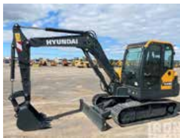
HX55S 작동 무게 : 5.560Kg 버킷 용량 : 0.18 m 3 정격 전력 : 36.2kw/2200rpm