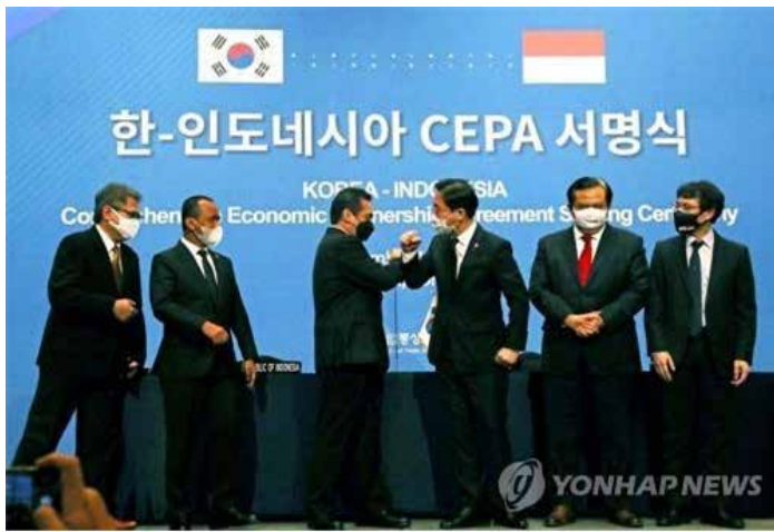
▲한-인도네시아 포괄적경제동반자협정(CEPA) 서명식

라진다. 수입액 기준으로는 2017~2018년 기준 한국은 97.4%, 인도네시아는 97.6%의 관세가 철폐된다. 인도네시아는 자동차 강판용 철강 제품(5~15%)과 자동차 용 스프링(5%), 베어링 등 기계 부품(5%), 의류(5%) 등을 한국에서 수입할 때 관세를 없애게 된다. 트랜스미션과 선루프(5%), 정밀화학제품(5%) 등도 즉시 또는 5년 이내에 무관세를 적용한다. 무역협회는 대(對) 인도네시아 수출 금액이 큰 플라스틱·고무제품과 자동차 부품 기업들이 수혜를 볼 것으로