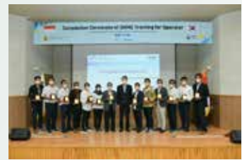
▲김일환 국토안전관리원 원장(가운데)과 인도네시아 공무원들이 수료식 뒤 기념촬영을 하고 있다. (국토안전관리원 제공)

간 진행된 연수에는 현지의 특수교 통합관리시스템을 운영할 인도네시아 공무원 13명이 참여했다.