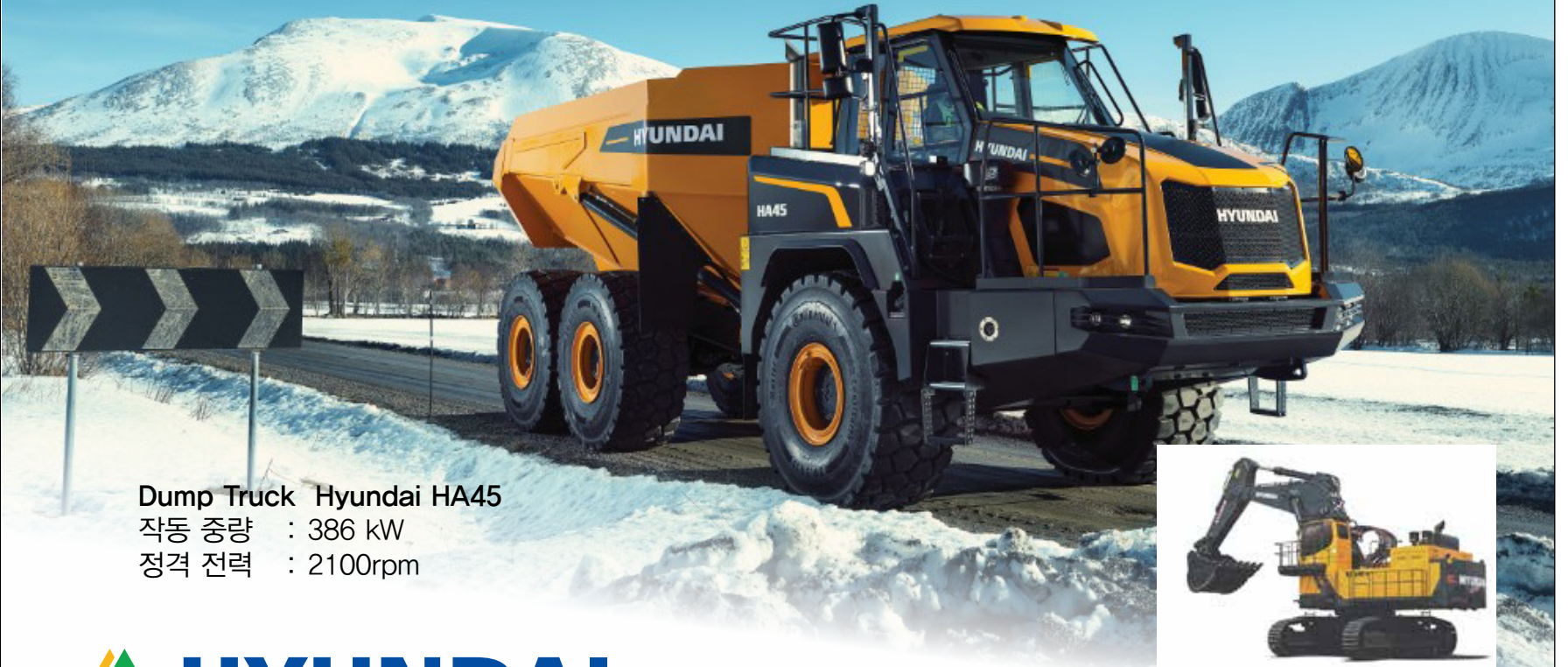
Dump Truck Hyundai HA45 작동 중량 : 386 kW 정격 전력 : 2100rpm

현대건설장비 아시아에서는 2022년 인도네시아 광업.광물전시회에 인공 덤프트럭 HA45와 굴착기 HX500L 출시 예정.