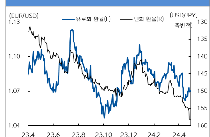
유로화와 엔화 환율 추이