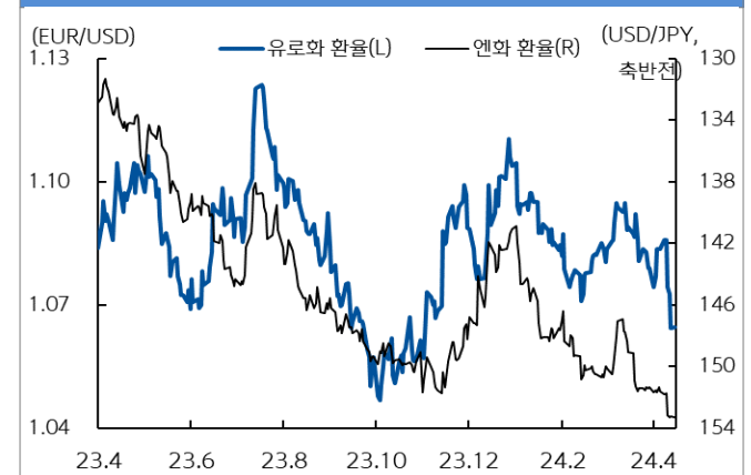
유로화와 엔화 환율 추이