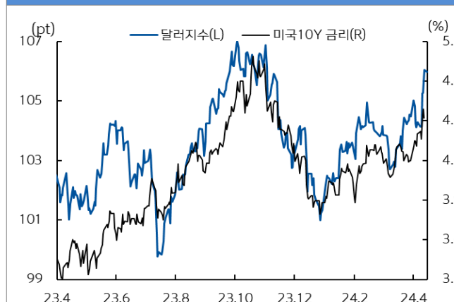
미국 국채 금리와 달러 지수 추이