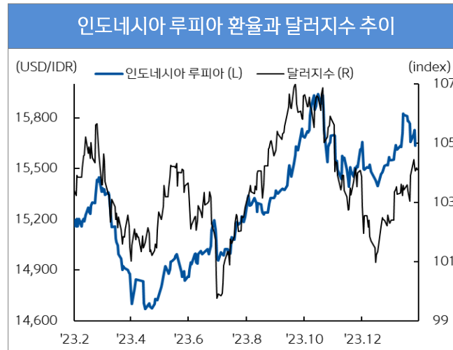
자료 : Bloomberg, 신한은행 S&T센터