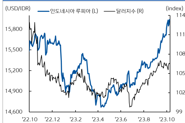
인도네시아 루피아 환율과 달러지수 추이