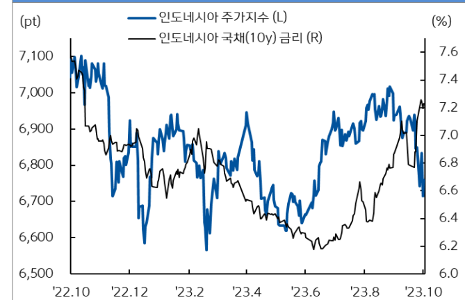
인도네시아 주가지수와 국채 금리추이