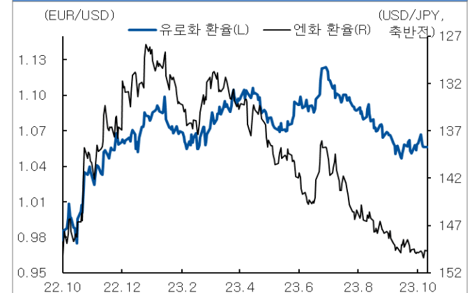
유로화와 엔화 환율 추이