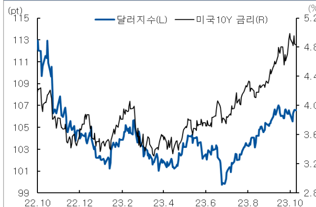
미국 국채 금리와 달러 지수 추이