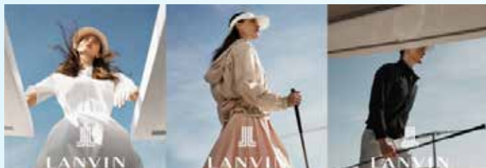
▲랑방블랑(LANVIN BLANC)이 2024 S/S 캠페인 한섬(대표 김민덕)이 전개하는 럭셔리 퍼포먼스 골프웨어 브랜드 랑방블랑(LANVIN BLANC)이 2024 S/S 캠페인을 공개했다.

랑방블랑의 2024 S/S 캠페인은 'Imagine, it's real - Invisible field'를 테마로 하늘과 맞닿은 수평선 너머 미지의 필드를 고급스러운 무드로 풀어냈다.