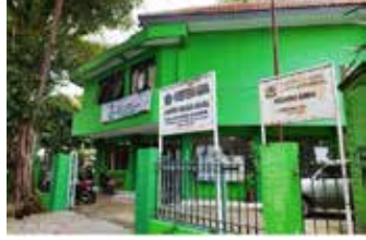
▲중부 자카르타 감비르에 있는 종교사무소(KUA) 건물.

종교부는 아직 해당 지역에 예배당을 짓지 못한 다른 종교를 가진 주민들도 종교사무소에서 혼인식을 올리는 것을 허용할 방침이다. 최근 종교사무소에서 결혼식을