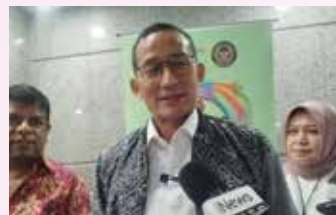
▲2월 26일 인도프린지@스콜라(IndoFringe@Sekolah 2024) 출범식이 끝난 후 기자와 인터뷰 중인 산디아가 우노 장관

산디아가 장관은 지난 2월 26일 자카르타에서 열린 인도프린지@스콜라(IndoFringe@Sekolah 2024) 출범식 직후 기자들과 만난 자리에서 "베트남, 태국, 말레이시아는 현재 무비자 정책을 시행하고 있으며, 인도 역시 인도네시아 국민에 대해 무비자 입국을 허용하고 있다"고 말