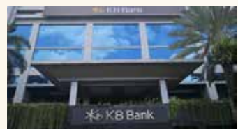
▲인도네시아 자카르타에 있는 KB뱅크 본점. KB국민은행의 인도네시아 자회사 은행이 이름을 뱅크 KB부코핀에서 KB뱅크로 4일(현지시간) 변경했다.

인도네시아 부코핀 은행 지분 67%를 인수하면서 경영권을 확보, 현지 은행 시장에 진출했다. 이어 사명을 KB부코핀으로 바꾸고 활동했다.