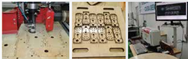
철판, 아크릴, 합판, 빼그라이트 등 레이저커팅