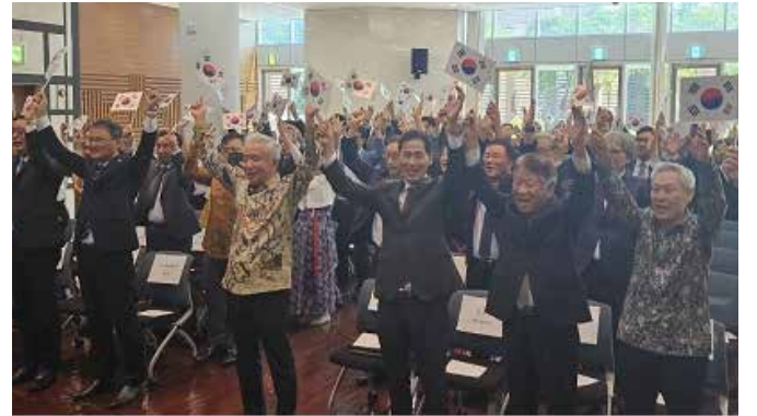
▲삼일절 참석자들이 만세를 외치고 있다.