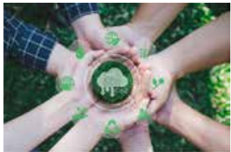
▲EU가 세계 최초로 탄소제거 인증제 도입을 추진한다.

유럽연합(EU)이 세계 최초로 ‘탄소제거 인증제’ 도입을 추진한다. 신규지침이 확정되면 기업의 탄소제거 기술 개발 및 보급 과정이 EU 기준을 충족할 때만 인증을 받을 수 있어 기후무역의 장벽이 더욱 높아질 전망이다. EU측은 인증제를 통해 그린워싱 방지와 민간 투자 촉진 효과도 기대하고 있다.