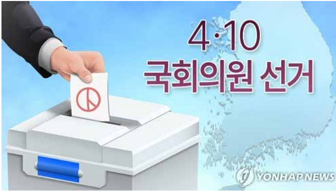
▲재외선거 (PG) 일러스트(권도윤 제작)

선관위는 유학생 및 일반체류자 등이 감소하면서 재외선거권자 수가 21대 총선(214만9691명)보다 17만5천316명(8.2%) 감