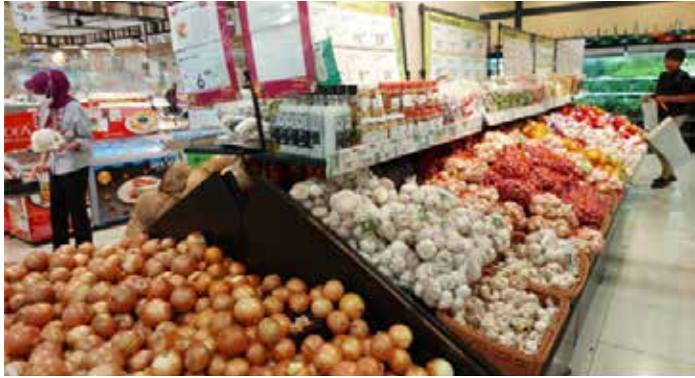
▲땅그랑의 대형 슈퍼마켓

인도네시아는 라마단 기간이 다가옴에 따라 2월 식품 가격이 전년 대비 8.47% 상승하는 등 변동성이 큰 식품 가격 급등에 직면해 있다고 자카르타포스트가 3월 1일 보도했다.