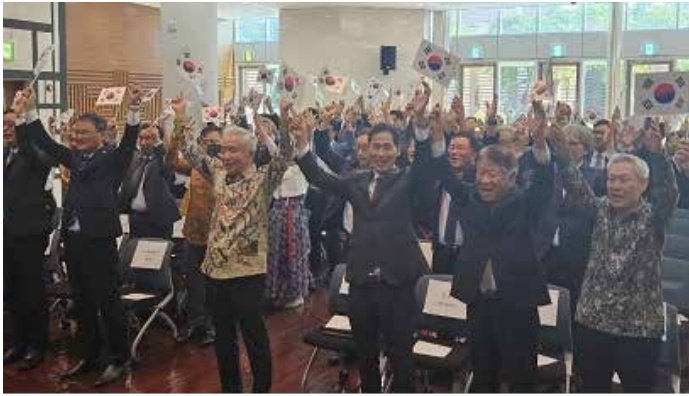
제105주년 삼일절 기념식이 3월 1일 주인도네시아 한국대사관 주최로 대사관 강당에서 열렸다.