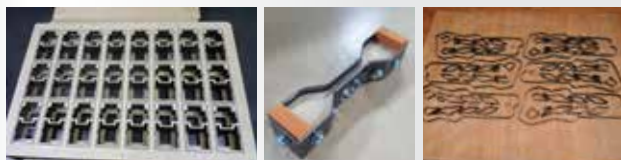
종이, 고무, 가죽, 스폰지, 아스테이지, PC, 필름 등 모든 자재 커팅금형의 최적금형의 대명사 "톱슨 목금형"

우수한 첨단장비로(CAD, Laser, Auto Banding)최상의 톱슨 목형을 제공하여 신속성, 정밀성, 경제성 이 월등하며 신발, 자동차부품, 전자부품 절단, 생산하는데 최상의 칼 금형