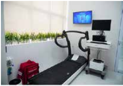
▲운동부하검사는 안정 시에는 얻을 수 없는 심혈관계 정보를 얻는 검사로, 운동을 시켜 심전도와 혈압의 변화를 측정한다.

인도네시아에서 한국 기준의 장비로 건강검진을 받고, 필요한 경우 신속하게 한국의 검사기관이나 병원을 연결해서 추가 검사와 치료를 진행할 수 있게 됐다.