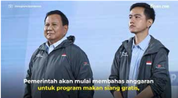
▲유력 대선 당선인 프라보워와 러닝메이트 기브란.

공약대로 8,290만명 급식 제공시 연 38조원 필요... “재정준칙 준수 기대”