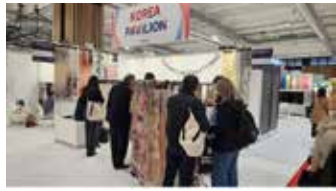
▲한국관에는 유럽의 다양한 바이어가 방문했다.

텍스월드파리 한국관 40개 업체, 1900만불 수출상담 380만불 현장 계약...세계 바이어 북적