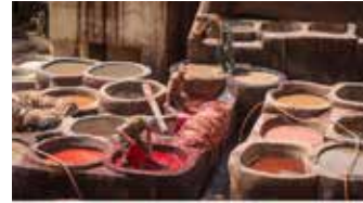
▲플래닛 트랙커가 패션브랜드 워터리스크 공개에 대한 리포트를 발표했다.

에 불과했다. 플래닛 트랙커는 29개 브랜드를 럭셔리, 비럭셔리, 소매, 총 3군으로 나누고 각 기업들이 워터리스크를 어떻게 인식하는지 분석했다. 보고서에 따르면 H&M, Nike 등 비럭셔리군이 69%로 워터리스크 공개수준이