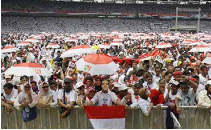
▲2019년 선거 당시 조코위 대통령의 선거 유세장 모습

인도네시아 중소기업부에 따르면 선거용품을 판매하는 소규모 지역 영세업체들은 수입 상품이 대량으로 유입되어 현재 캠페인 시즌 동안 매출이 급감했다.