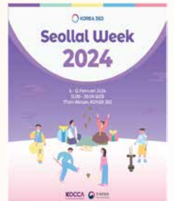
▲2024년 설날주간 포스터 (주인도네시아 한국문화원)