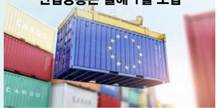
▲유럽의회 법사위가 EU 산업별 ESG공시 유예안을 승인했다.

8개산업·비EU대기업 도입 늦춰져...공시 기준 마련 돌입 유럽 시장의 패션산업 ESG 공시 도입 시기가 유예됐다. 유럽의회 법사위는 지난 24일 유럽지속가능성공시기준(ESRS)에 기반한 산업별 ESG 공시 도입 시기를 올해에서 2026년으로 2년 연기하는 EU 집행위원회의 법안을 통과시켰다. 업종과 무관한 산업공통 ESG공시 의무화는 2024년 1월부터 약 5만개 기업을 대상으로 시행 중이다.