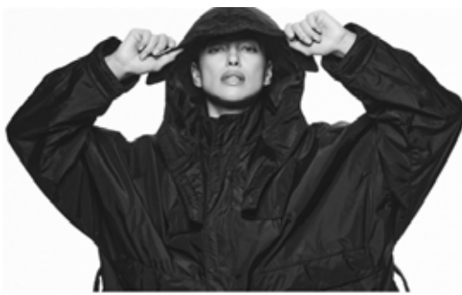
▲자라에서 출시한 100% 섬유폐기물 재활용 소재 '루파미드'로 만든 재킷.

인디텍스가 개발한 '루파미드'는 100% 섬유폐기물로 만든 폴리아미드6(PA6)로 기존 PA6와 재료 특성이 동일하며 직물 간 재활용이 가능해 나일론 최초로 순환성을 갖춘 소재다. 인디텍스 소속브랜드 자라는 여러 제조업체들과 협력해 원단은 물론 단추, 충전