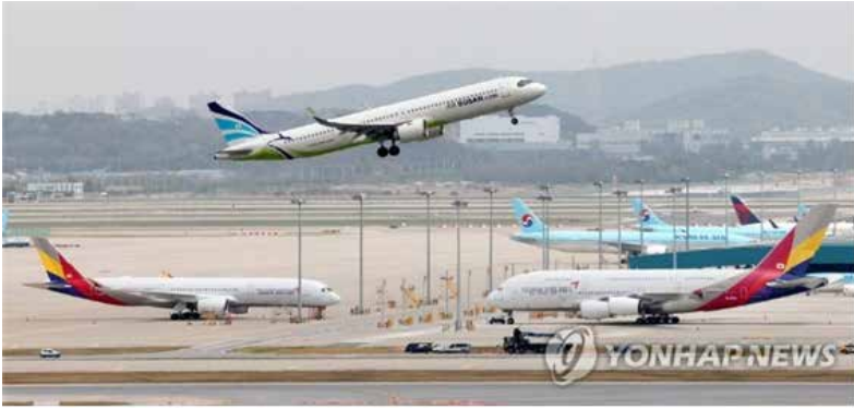
한·인니, 하늘길 확대...6개 지방공항간 운항 자유화 국내 지방공항~자카르타, 국내 지방공항~발리 노선을 각각 주 7회씩(총 28회) 추가 운항.