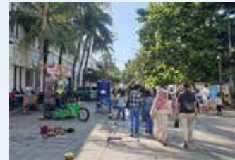
▲꼬따 뚜아(Kota Tua) 파티힐라 광장

인도네시아 정부는 사회활동 제한조치(PPKM)를 인도네시아 전역에서 1단계를 유지하며 10월 4일부터 11월 7일까지 한달 간 다시 연장했다.