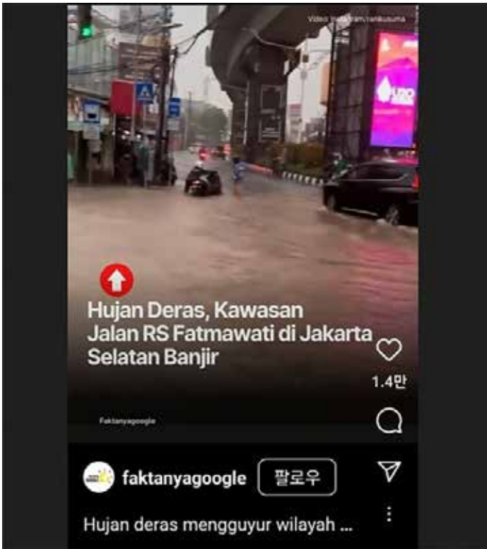
▲소셜미디어에 올라온 남부자카르타 파드마와띠 병원 도로 침수 영상 (인스타그램@faktanyagoogle 영상 캡처)

지난 며칠간 자카르타와 수도권 일대에 집중 강우로 인해 대규모 침수사태가 벌어져 주택지를 덮치고 주요 도로를 범람했다. 하지만 아직도 다 끝난 것은 아니어서 국가방재청은 긴장의 끈을 놓아서는 안된다고 경고하고 있다. 폭우로 인한 범람과 홍수는 인도네시아의 다른 지역들도 강타했다. 전국적으로 이번 주 후반에 더 많은 강우가 예고되어 있다. 6일자 자카르타포스트에 따르면, 수도권 여러 지역에서 4일(화요일) 오후부터 시작된 폭우로 빵으란 안따사리(Jl. Pangeran Antasari), 렌텡 아궁(Jl. Lenteng Agung), 가뭏 수브로토(Jl. Jenderal Gatot Subroto) 등 여섯 개 간선도로가 물에 잠겼고 주택지에서는 다음 날 아침까지도 차오