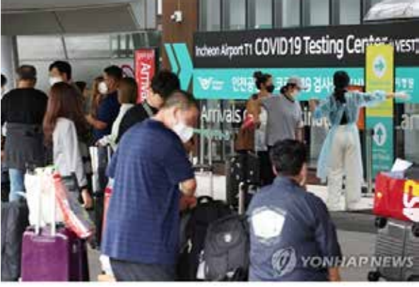
'입국 후 PCR 검사' 안 받아도 된다... 10월 1일부터 필요하면 PCR 재도입 검토... 접촉면회, 음성 확인 후 마스크 쓰고 접촉요건 충족시 외출·외박과 외부 프로그램도 허용