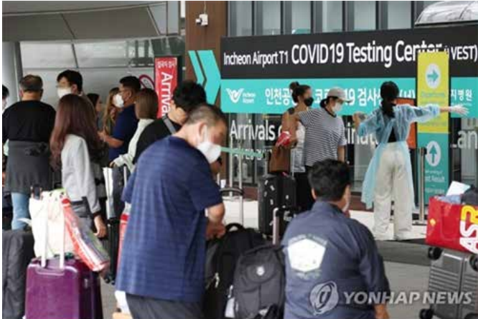
▲입국 뒤 PCR 검사 받는 외국인 관광객들(연합뉴스 자료사진)

앞서 입국자 격리의무 해제, 입국 전 검사 해제가 시행된 데 이어 이번 조치로 국내 입