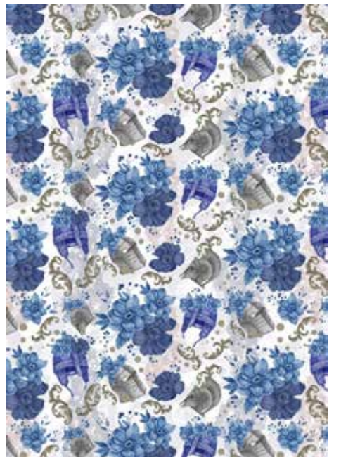
▲작품명 : The incarnation of war 황진연 작

2021년 제9회 코리아 텍스타일 디자인 어워드((Korea Textile Design Award) 수상작입니다. 해당 분야의 전문 교수들로 구성된 한국 패션비즈니스학회와 섬유·패션의 전통의 전문매체인 한국섬유신문의 산학협력에 큰 관심 부탁드립니다.