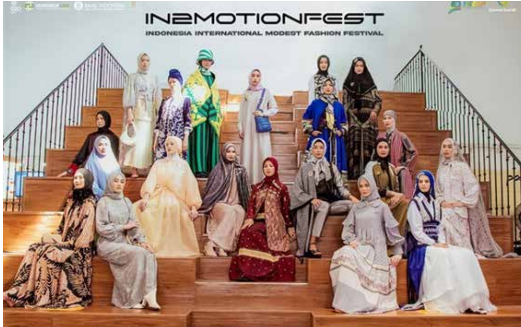
▲Indonesia International Modest Fashion Festival 2022 (IN2MOTIONFEST) will be held from 5-9 October 2022 at the Jakarta Convention Centre, Jakarta, Indonesia.

2022년 주제: '지역 제품, 세계적인 룩' 수십억 달러 규모의 모디스트 패션 산업에서 독특한 디자인, 지역에서 조달한 소재 및 유행하는 룩을 기념하기 위해, IN2MOTIONFEST가 160개 이상의 지역과 국제 디자인