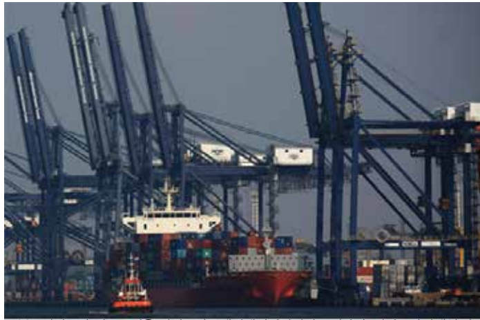
▲북부자카르타 만중쁘리옥 자카르타국제컨테이너터미널JCT

이는 인도네시아의 주요 원자재들, 특히 석탄과 팜원유(CPO)의 가격이 높은 시기에 국내 수출업자들에게 도움을 주었는데, 이 원자재들은 총 수출에 각각 약 18%와 12%를 기여했다. 인도네시아의 1~8월 무역수지 흑자는 전년 동기 대비 68.6% 증가한 349억2천만 달러를 기록했다. 그러나 수출 지향적인 기업들은 불황이 그들의 재정에 미칠 영향을 경계하고 있다. 인도네시아 팜오일협회(Gapki) 에디 마르