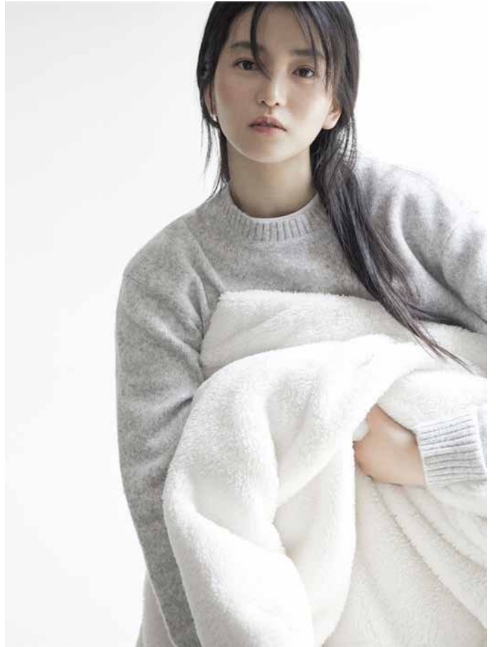
▲에이션패션이 올해 매출 4000억원을 목표로 빠르게 성장하고 있다.

폴햄은 내년에도 에이지리스한 착한 브랜드로 행보를 이어가고 여성 제품을 35% 이상으로 구성할 예정이다. 프로젝트엠은 내년에 영한 스트리트 무드의 'PRJCT' 라인을 확장할 예정이다. 또, 프로