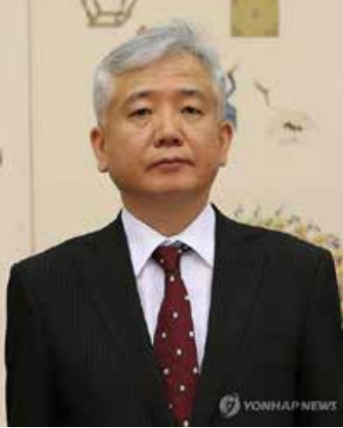
한국 외교부는 26일 주인도네시아대사에 이상덕 전 주싱가포르대사를 임명했다. 주인도네시아대사에 선임된 이상덕 전 대사는 전직 외교관으로 외교부 동남아과장, 동북아시아국장 등을 지냈다.