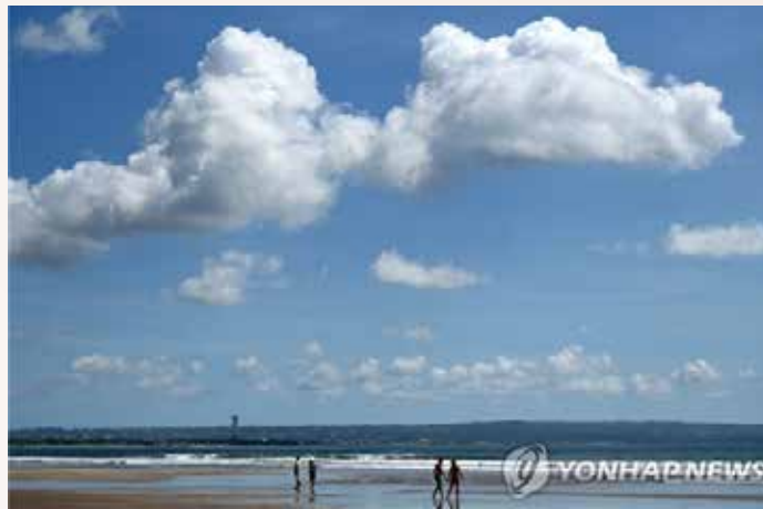
▲인도네시아 발리 해변

산디아가 장관은 올해 외국인 관광객 유치 목표는 지난해 목표치(360만 명)의 2배가