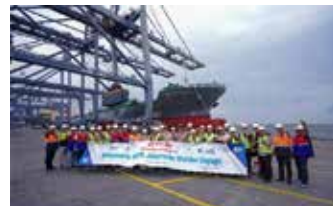
▲남성해운, 자카르타항 기항 행사

남성해운은 수라바야 등 인도네시아 다른 지역 서비스를 확대하는 한편 부산항만공사의 자바 물류센터 등과 연계한 물류사업을 추진하는 방안도 검토 중이다.