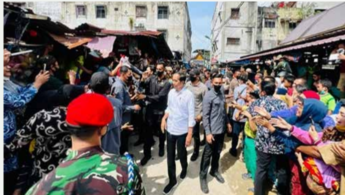
▲조코위 대통령이 5일 리아우 주 두마이 시 분다스리메르시 시장에서 상인과 시민들과 인사하고 있다.

전날 리아우 주를 방문한 조코위 대통령은 언론과의 회견에서, 자세한 내용 없이 개각을 계획하고 있다고만 밝히면