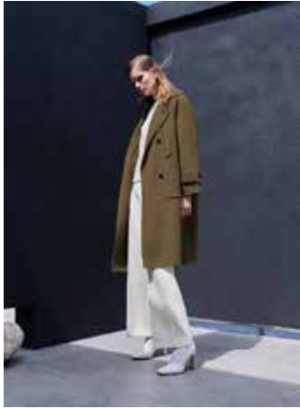
▲비지트인뉴욕의 윈터 아우터 컬렉션은 구스다운 뿐만 아니라 스웨이드 무스탕, 핸드메이드 코트 등 전체적으로 높은 판매율을 보이며 전년대비 35%의 매출 신장을 기록했다.

디케이앤코(회장 이재수)가 전개하는 뉴요커 감성의 어반 컨템퍼러리 브랜드 '비지트인뉴욕(VISIT IN NEWYORK)' 이 겨울 아우터 강자로 떠올랐다.