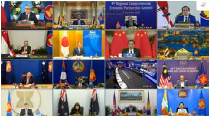
▲2020년 11월 15일 아세안 정상회의 기간 중 온라인으로 열린 제4차 역내포괄적경제 동반자협정(RCEP) 정상회의에서 각국 대표들

인도네시아 정부는 최근 비준된 역내포괄적경제동반자협정(RCEP)의 후속 조치로 인도네시아에서 수출되는 물품의 원산지 규정과 원산지 증명서 발급 규정에 관한 새 규정을 발표했다. 지난달 30일자 자카르타포스트에 따르면, 무역부 장관령 56/2022호를 통해 규정된 새