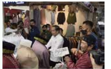
▲조코위 대통령이 마스크를 착용하지 않은 채 떠나야방 시장에서 상인들과 인사하고 있다.

에 따라 인도네시아 최대 섬유류시장인 떠나야방 시장의 경제활동이 2023년에는 더 활발해질 것으로 기대한다고 말했다. 조코위 대통령은 대다수의 인도네시아인이 백신을 접종함에 따라, 코로나19 확산을 막기 위해 시행했던 사회활동제한(PPKM)조치를 12월 30일부터 해제한다고 발표했다. 보건부 자료에 따르면, 6세 이상 인도네시아 인구의 75%인 1억7,470만 명이 최소 1차 이상 백신을 접종했고, 2차 접종까지 마친 사람은 약6,850만 명이다. 최근 조코위 대통령은 자카