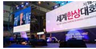
▲ 2019년 제18차 세계한상대회 모습

재외동포재단(이사장 김성곤)은 올해 10월 19일(화)~ 21일(목)까지 열리는 제19차 세계한상대회 개최 장소를 대전광역시에서 서울특별시(잠실 롯데호텔)로 변경한다고 밝혔다.