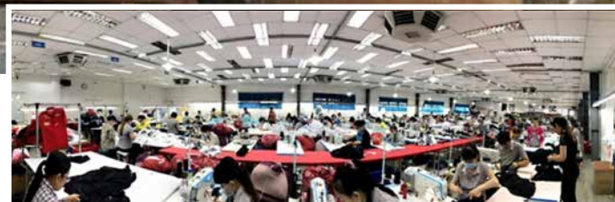
▲ 락다운 이전 봉제 공장 모습.