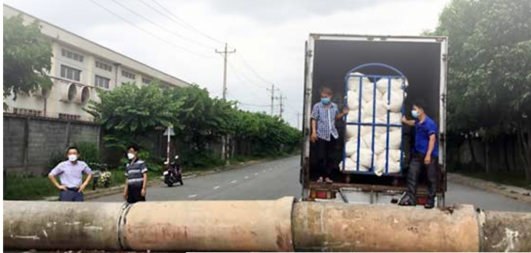
▲코로나 19 확진자가 증가하면서 베트남 호치민시와 빈중성 거리 곳곳이 통제되고 있다. 빈중성 산업단지 앞도 배관 배리케이트로 길이 막혀 공장 직원들이 편직생지를 지게 차로 이동시키고 있다.

코로나 락다운으로 공장들 수십억원씩 손실 한국 봉제공장 찾지만 마땅한 곳 없어 난감