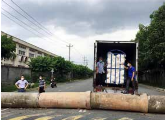
훈돈의 베트남, 봉쇄 풀려도 물류대란 폭탄 터진다