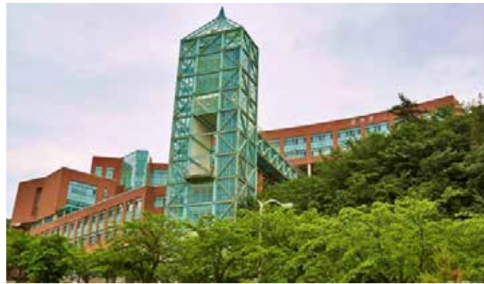
▲신라대는 KOICA와 ‘인도네시아 탕에랑 4차 산업혁명 기술전문 인력 양성사업’ 추진을 위한 업무협약을 체결했다.

지난 3일 온라인 입학식 열려 신라대, KOICA, UMN에서 추진하는 4차 산업혁명 기술전문 인력 양성사업의 입학식이 지난 3일 온라인으로 열렸다.