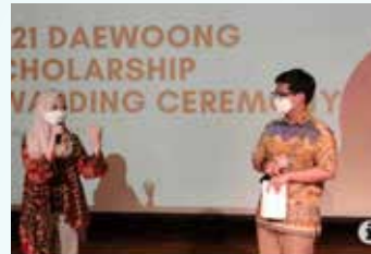
▲대웅제약이 인도네시아 학생들을 대상으로 장학금을 전달했다.

학사업을 통해 인도네시아 최고의 인재를 지속적으로 발굴·육성함으로써 인도네시아 보건 분야에 기여하고 싶다”면서 “특히 올해는 헬스케어 산업의 미래 방향성에 대한 공모를 통해 선발된