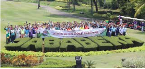
2019년 제 30회 인니 본제인 축제의 장 열린다.

재인니봉제협회(KOGA)는 오는 29일(화) 자바베카 골프장에서 30회 봉제인 축제를 연다. 비상하는 코가는 회원들의 적극적인 참여로 만들어 질것이다.