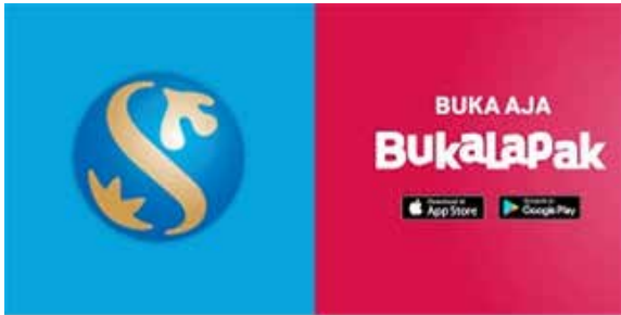
▲ 이미지: 데일리인도네시아 편집

신한금융이 인도네시아 전자상거래기업 부까라팍(Bukalapak)에 투자한다고 다우존스가 4일 보도했다.