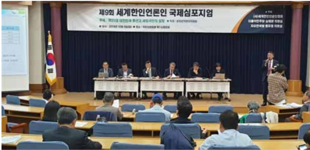
▲ 재외동포 비례대표 선출 중요성 관련 포럼

이탈리아, 프랑스, 포르투갈은 각각 총의석 630석, 577석, 230석 대비 12석(1.9%),