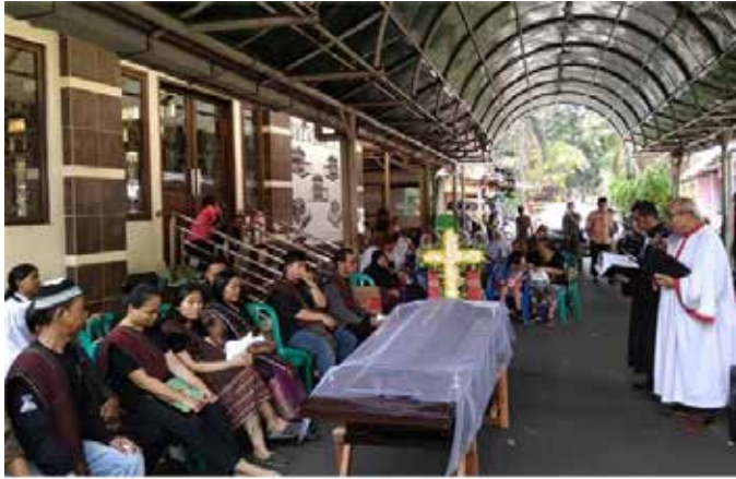
▲ 이슬람 사원에서 기독교인 장례예배가 진행되고 있다.

관이 들어올 수 없었다. 가족들은 마을 입구에 있는 다루살람 모스크 마당에서 장례예배를 볼 수 있게 해달라고 모스크 측에 도움을 요청했다. 가족을 대표해 모스크 측에 마당 사용을 요청했던, 제퍼슨은 “다행히도 모스크 마당