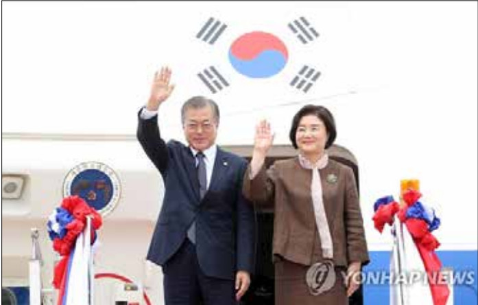
라오스를 국빈방문 중인 문재인 대통령은 6일 “우리에게 아세안과의 협력은 지속가능한 성장기반을 만드는 일이다. 특정국가에 대한 의존도를 줄여 수출을 다변화하고 자유무역의 영역을 확대하는 길”이라고 말했다.

SNS에 ‘아세안 10개국 방문’ 소회 ... 교량국가 되려면 아세안과 굳게 손잡아야 아세안 10개 나라 특징 열거... “우리 경제의 희망 안고 돌아간다” ‘한·아세안 특별정상회의’에 국민협조 당부...” 공동번영 씨앗 심는 회의”