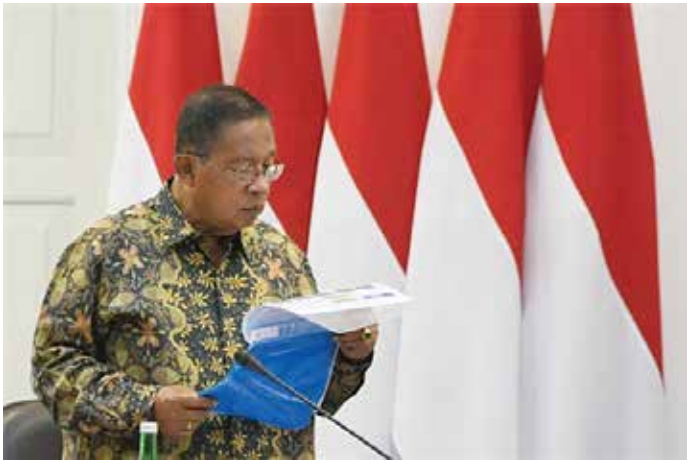
▲ 다르민 나수피온 (Darmin Nasution) 경제조정장관

인도네시아 중앙은행(BI)은 4일 중앙정부와 금융감독청(OJK)과 제조업을 지원하기 위한 여섯 가지 정책을 제시했다고 발표했다.