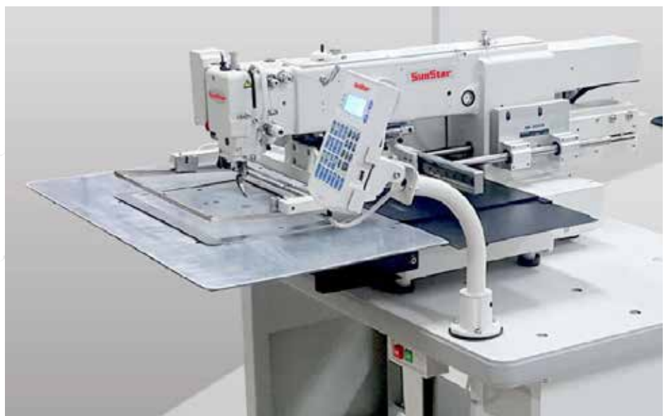
신형패턴 SPS/R-3020H, 2010H