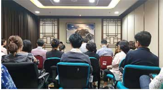
▲ 5일 KEB하나은행 인니 법인 향의 방문한 한국인 피해자들

지와스라야는 지급불능 상태에 빠진 지 열 달이 지난 현재까지 극소수 소액 피해자에게만 원금을 찾을 뿐, 나머지 피해자들은 기약 없이 기다리는 상황이다.