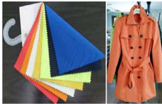
▲ 이루삼이 개발한 방사선 차폐소재 ‘루텍스(RU-TEX)’는 트렌치 코트, 아웃도어스포츠에서 벽지, 커튼까지 섬유소재 제한 없이 적용할 수 있다. 루텍스 방사선 차폐원단(왼쪽)과 루텍스로 만든 투습방수 여성용 트렌치 코트.

이전까지 방사선 차폐 소재는 인체 중독성이 강한 납 분말을 사용, 무거우면서 활