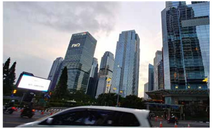
▲ 자카르타 시내

한화투자증권은 5일 미중 무역분쟁의 장기화로 국내 의류 주문자상표부착생산(OEM) 업체들이 수혜를 볼 것이라며 의류 산업에 대해 '긍정적' 투자 의견을 제시했다.