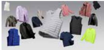
▲ 무신사 스탠다드'는 경량 패딩인 라이트다운을 업그레이드해 출시하고 오는 28일까지 선판매에 나선다.

온라인 패션 스토어 무신사의 자체 상표(PB) 브랜드 '무신사 스탠다드(musinsa standard)'는 국민 경량 패딩으로 불리는 라이트다운을 업그레이드해 출시하고 시장 선점에 나선다. 2019년 F/W 시즌을 맞아 프리미엄 덕다운 소