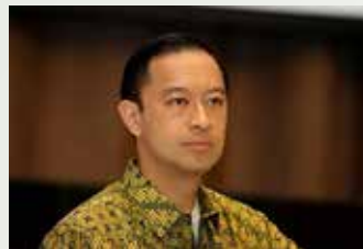
▲ 토마스 렘봉(Thomas Lembong) 투자조정청장

인도네시아 투자조정청(BKPM)이 최근 한국을 방문해 현대자동차, 포스코, 롯데등과 연쇄 회동을 갖고 이들 기업의 인도네시아 투자 유치를 추진 중인 것으로 알려졌다.