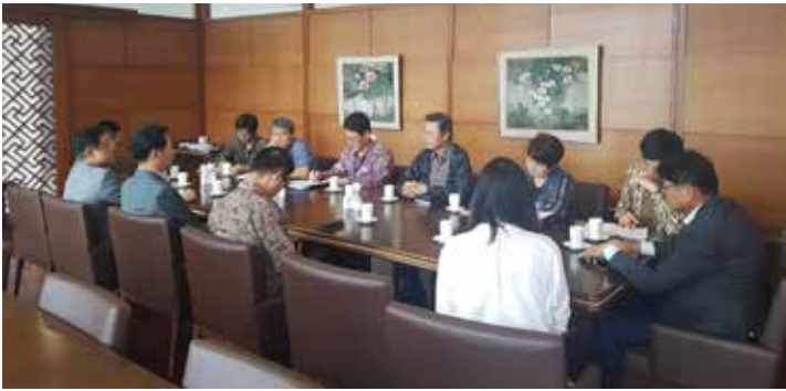
대사관, 코참, 코가 ... 기업 경영활동 지원 서비스 강화를 위한 간담회 열어