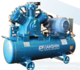
NH 시리즈(피스톤 콤프레서) 국내 최대 판매, 유일 수출 피스톤 콤프레서 (1~20마력)