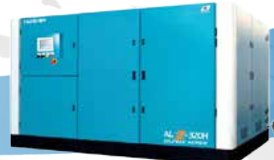
AL, CDH 시리즈 (오일프리 콤프레서) 완벽한 오일 차단, 최장의 운전시간 보장, 최고의 오일프리 스크류 사용 AL 시리즈 : Kobelco(일본) CDH 시리즈 : GHH-RAND(독일)