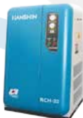
RCH 시리즈 (소형스크류 콤프레서) 설치면적 최소화, 경량화, 정숙화 실현 (5~20 마력)