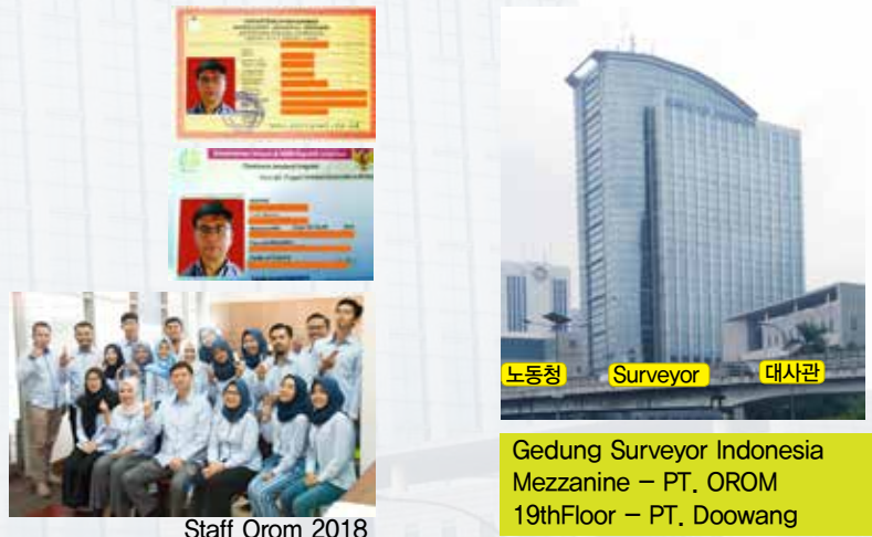
Staff Orom 2018