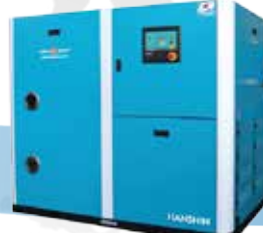
GRH 시리즈 (오일 인젝션 콤프레서) 스크류 : 독일(GHH-RANDSA) 세퍼레이터 : 일본