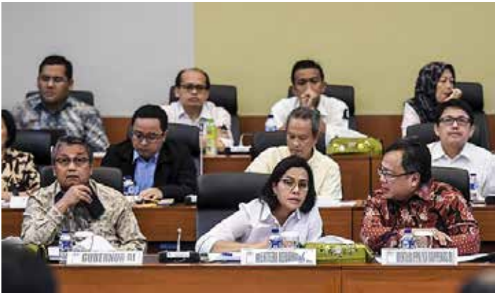
▲ 지난 10월 31일 인도네시아 의회(DPR, 하원)는 2019년 국가 예산안을 승인했다.

인도네시아의 2019년은 대선과 총선으로 많은 변화가 예상되는 해로 정치경제환경과 정책적 변화도 많은 영향을 받을 것으로 예상된다. 그룹에도 불구하고 최근 발표된 2019년 예산안에 따르면, 올해 경제 정책의 전체적인 틀은 지난해와 크게 다르지 않을 것으로 전망돼 주목된다. 인도네시아 정부의 각 부처는 최근 2019년 국가 예산안(APBN 2019)을 기준으로 주요 경제 지표의 전망을 제시했다. 이에 따라 인도네시아 국가개발계획(BAPPENAS: 바빠나스)은 각 산업별 예상되는 성장률을 제시했으며, 특