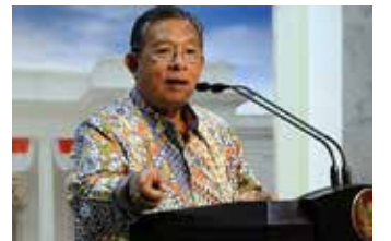
▲ 다르민 나수스띠온 인도네시아 경제조정장관

7일자 현지 인베스터 데일리의 보도에 따르면, 다르민 나수스띠온 인도네시아 경제조정장관은 지난해 11월 발표한 ‘16차 경제정책 패키지’에 대해 이달 안으로 자세한 규정을 공포할 생각을 나타냈다. 다르민 장관에 따르면, 조세 감면혜택(법인세 일시 면세)에 대한 재무장관령은 이미 완료됐으며 현재는 외자 기업의 지분을 제한하는 네거티브리스트(투자 규제 분야)에 관한 대통령령과 자원 수출로 얻은 이익의 국내 계좌 예치 의무에 관한 법령에 대해 책정을 서두르고 있다. 인도네시아 싱크탱크 경제개혁센터(CORE)의 모하마드 센터장은 “네거티브리스트 관