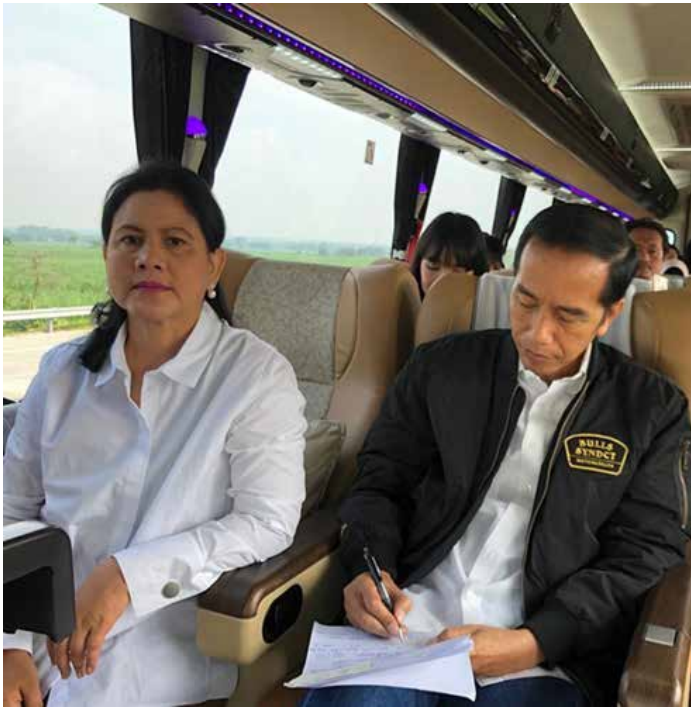
▲ 조코위 대통령과 이리아나 여사가 20일 버스를 타고 트란스자바 고속도로를 달렸다.

자바 섬 북부해안에 있는 수도 자카르타와 제2 도시 수라바야를 연결하는 연장 760km의 트란스자바 고속도로(Trans Jawa)가 착공 40년만에 연결됐다고 21일 현지 언론이 보도했다. 트란스자바 고속도로는 2021년에 자바섬 북부해안 서쪽 끝에 있는 머락과 동쪽 끝에 있는 빠수루안까지 연결되면 총 길이가 993km가 된다.