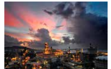
▲ 포스코 인도네시아 제철소, 긴급 구호 활동 펼쳐

포스코그룹은 지난해 8월과 10월 인도네시아 지진 피해 복구를 위해 각각 13만 달러와 50만 달러의 성금을 기부했으며, 9월에는 포스코 인도네시아 제철소가 위치한 찰레