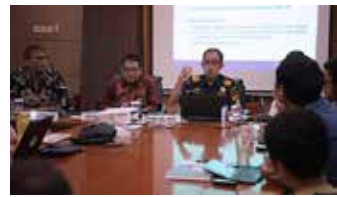
▲ हे루 관세국장(가운데)

인도네시아 재무부는 수출입 절차의 전자 데이터베이스 온라인에서 상호 이용하는 시스템 'PDE 인터넷(PDE Internet)'의 운영을 1월 1일부터 전국 모든 세관감독사무소(Kantor Pengawasan dan Pelayanan Bea dan Cukai, KPPBC)에서 일제히 시작했다고 밝혔다.