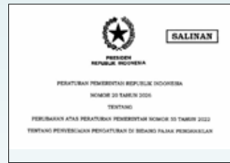
▲인도네시아 정부가 중소기업(UMKM)에 적용해 온 0.5% 최종 소득세(PPH Final) 규정을 담은 ‘2026년 정부 규정 제20호’를 공포했다. 2026.5.31.

구체적인 사례로, 2023년 6월 20일에 납세자로 등록된 매출 48억 루피아 미만의 유한합