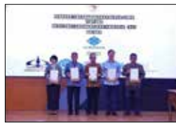
노동부 전략적 파트너 임명 (2024.5)