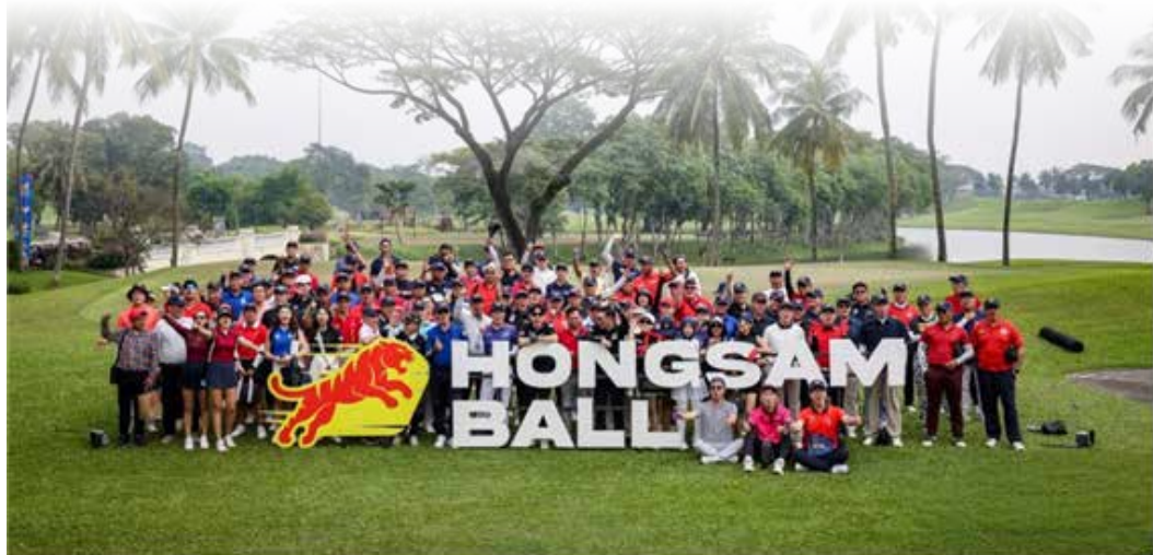
▲홍삼볼 인도네시아 런칭기념 골프대회. 2026.6.13.