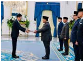
▲프라보워 인도네시아 대통령에게 신임장을 제정하는 윤순구 대사

윤순구 인도네시아 한국 대사가 부임한 지 6개월 만에 프라보워 수비안토 인도네시아 대통령에게 신임장을 제정했다. 주인도네시아 한국 대사관에 따르면, 지난 6월 8일(현지시간) 프라보워 대통령은 수도 자카르타에 있는 대통령궁에서 윤 대사로부터 신임장을 전달받았다. 신임장은 파견국의 정상이 접수