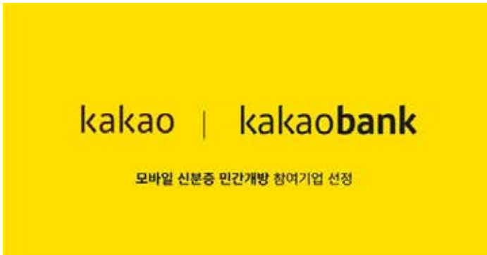
▲카카오·카카오뱅크, 모바일 신분증 민간개방 참여기업 선정

성과급 갈등으로 노조 600명 판교 거리 행진... 대사관 영사서비스 채널 우려 동포 사회도 촉각