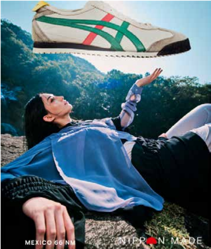
▲오니츠키 타이거가 내년 1월 OT그룹으로 사업 승계된다.

일본 아식스가 오니츠키 타이거 사업을 분사한다. 아식스는 6월 10일 이사회에서 오니츠키 타이거 브랜드 관련 사업을 100% 자회사인 OT그룹으로 승계하는 회사분할 방침을 결정했다. 효력 발생 예정일은 2027년 1월 1일이다. 이번 조치는 오니츠키 타이거를 아식스의 스포츠 퍼포먼스 사업과 분리해, 독립성이 높은 글로벌 라이프스타일 브랜드로 운영하려는 전략적 재편으로 해석된다. 아식스가 밝힌 분사 방식은 ‘간이 흡수분할’이다. 아식스가 분할회사, OT그룹이 승계회사가 되며, OT그룹은 오니츠키 타이거 사업 관련 자산·부채·계약 등 권리와 의무를 승계한다. 아식스는 이번 재편이 연결