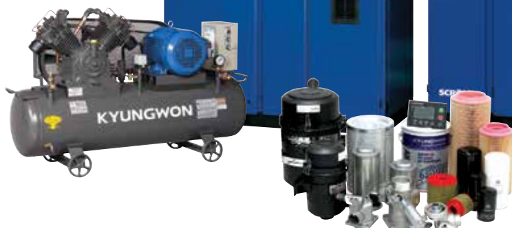
KYUNGWON COMPRESSOR GENUINE PARTS