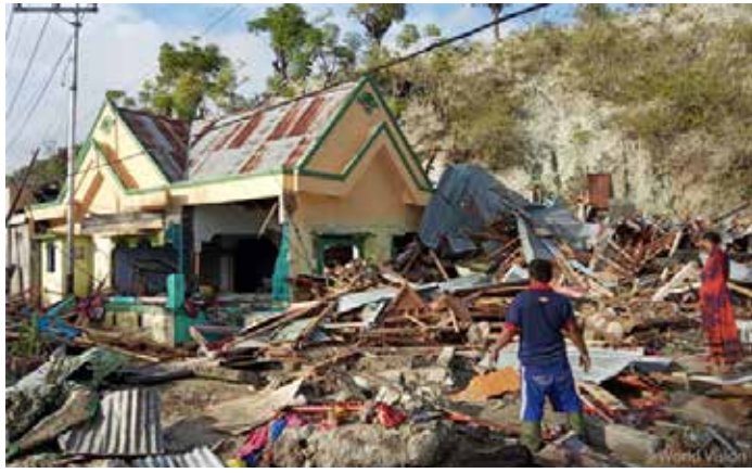
▲지진과 쓰나미가 지나간 팔루(Palu) 지역의 모습

한 지진이 발생했다. 16일 오전 11시 27분께 술라웨시섬 팔루 인근에서 규모 6.7 지진이 발생해 8명이 다쳤다. 미국 지질조사국은 진원 깊이를 10km로 분석했으며 진앙은 인구 약 39만 명의 도시 팔루에서 남동쪽으로 43km 떨어