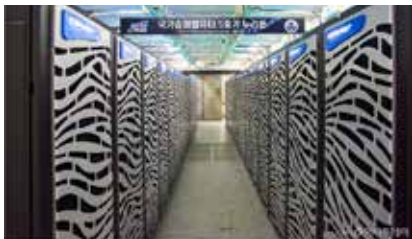
▲국가슈퍼컴퓨터 5호기 누리온

국가 초고성능컴퓨팅인프라를 운영하는 KISTI(한국과학기술정보연구원)가 한-아세안(ASEAN) 디지털 협력의 일환으로 인도네시아에 고성능컴퓨팅(HPC) 인프라를 구축한다.