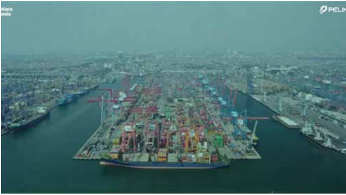
▲자카르타 탄중쁘리옥 항구

인도네시아 최대 항구인 자카르타 탄중쁘리옥항에 최근 1만여 개에 달하는 컨테이너가 적체돼 수입 물품이 원활하게 유통되지 않고 있다. 관세청은 통관 완료 후 기업들이 반출하지 않았기 때문이라고 주장하고 있으나, 문제점은 해결되지 않고 상황은 악화되고 있는 실정이다. 관세청의 관료주의적 행정 지연인지, 구조적인 문제인지 서로 책임을 전가하고 있다. 16일 현지 언론 보도에 따르면 자카 부디 우타마 관세청장은 이날 국회 청문회에서 인도네시아 최대 항만인 탄중쁘리옥의 통관 절차는 국가 서비스 기준에 따라 정상적으로 운영되고 있었지만, 수입업체들이 화물 반출 허가를 받은 이후에도 항만 보관 시설을 계속 이용하면서 수천 개의 컨테이너가 항만에 묶여 있었다고 밝혔다. 그는 “항만 내 컨테이너 적