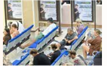
▲인도네시아 발리 주재 이민국에서 대기중인 외국인들

갈취 및 뇌물 수수’로 규정하며, 향후 징수되는 모든 수수료는 전액 국고로 납입된다고 강조했다.