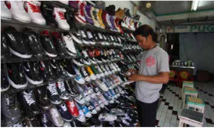
▲기사 내용과 관련없는 이미지

서부자바 반동의 글로벌 스포츠 브랜드 나이키(Nike)와 푸마(Puma)에 신발을 공급하는 공장에서 생산 주문 감소로 약 4천명의 근로자가 일시 휴직 상태에 들어가 대규모 해고 우려가 제기되고 있다고 자카르타글로벌브가 22일 전했다. 쁘라보워 수비안토 대통령의 노동 및 근로자복지 특별보좌관인 사이드 이크발은 해당 근로자들