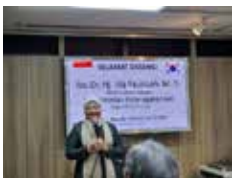
노동부 장관 BIC 방문 (2022.12)