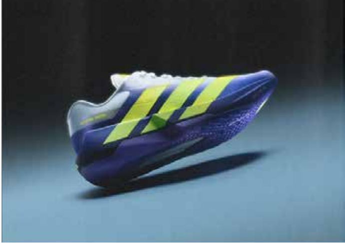
▲러닝화와 트레이닝화의 핵심 기술을 모두 합쳤다.

아디다스가 러닝의 스피드와 근력 운동의 안정성을 결합한 하이브리드 트레이닝화 ‘아디제로 드롭셋 프로’가 18일 출시된다. 글로벌 리딩 스포츠 브랜드 아디다스가 러닝의 스피드와 근력 트레이닝의 안정성을 한 컬레에 담은 하이브리드 트레이닝화 ‘아디제로 드롭셋 프로 (Adizero Dropset Pro)’를 오는 6월 18일 출시한다.