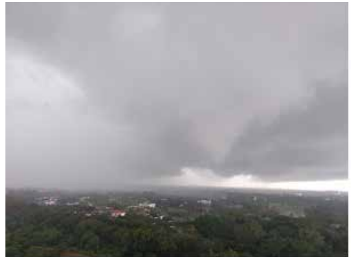
▲우기에는 천둥번개를 동반한 국지성 폭우가 수시로 내린다. 2024.1.10

인도네시아 전역이 우기에 접어든 가운데 홍수, 산사태, 화산 분출이 수시로 일어나고 있어 주의가 요구된다.