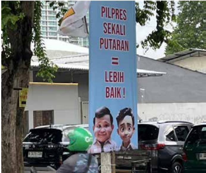
▲자카르타 시내에 걸려 있는 2024년 대선 후보 프라보워-기브란 포스터. [데일리인도네시아 자료사진]

새달 14일 열리는 인도네시아 대선을 앞두고 지지율 1위 후보인 현 국방부 장관의 지지율이 50%를 넘기는 여론조사 결과가 나왔다. 대선에서도 여론조사와 같은 결과가 나오면 결선투표 없이 1차 투표에서 차기 대통령이 정해지게 된다.