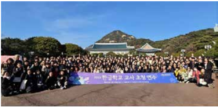
▲한글학교 교사 초청 연수 [동포청]

한글학교 운영비·교사연수 예산 각 25.7%, 44.7% ↑ 이기철 청장 "한글학교와 교사, 차세대 자긍심 제고에 중요 역할"