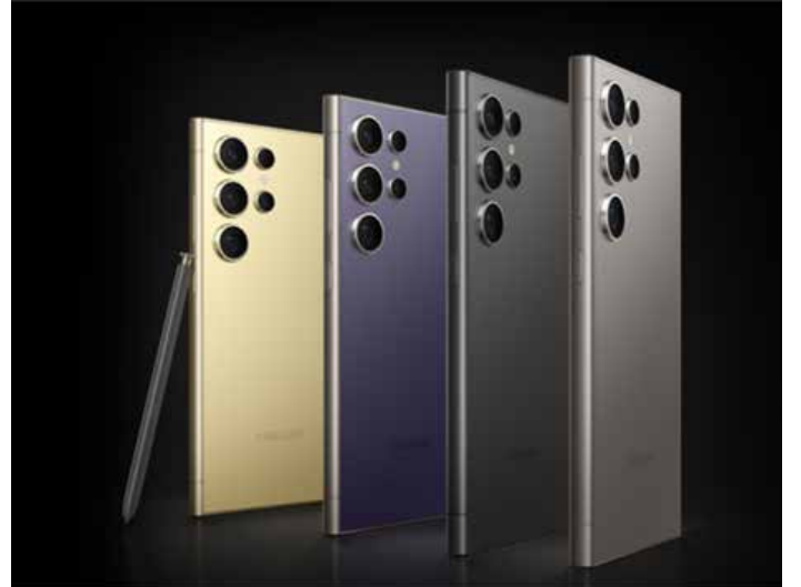
▲갤럭시 S24 이미지