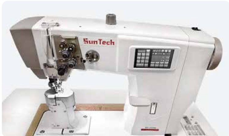
ST-666H(롤러 1본침), ST-777H(롤러 2본침)