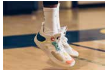
▲착장한 아디다스 하든 Vol.5

아디다스는 하든 Vol.5 출시를 밝혔지만 현재로서 알려진 것은 2021년 초라는 사실밖에 없다.