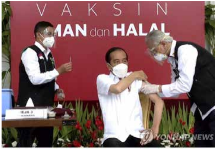
▲ 조코위 대통령이 2021년 1월 13일 수요일에 전국에 생방송 되는 가운데 코로나19 백신을 맞고 있다.

력(월·화·수·목·금·토·일)과 1주일이 5일인 자바력(ge·Kliwon·Legi·Pahing)을 섞어서 길일을 계산하는 자바 전통 문화 가운데 하나이다. 그렇다면 자질룰의 예측은 맞았을까? 부분적으로 맞았다. 조코위 대통령은 두 번째 임기 중 첫 개각을 2020년 12월 22일 화요일에 발표했고, 신임 장관 6명의 취임식은 다음날인 수요일에 거행했다.