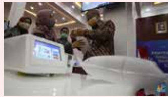
▲ 가자마다대학교(UGM)에서 연구개발한 코로나19진단 도구 'GeNose'

'GeNose'는 가자마다대학교(UGM)에서 연구개발한 코로나19진단 도구로써, 숨을 불어넣은 공기주머니를 인공지능 기반의 본체에 연결하여 코로나19 감염 여부를 진단한다. 2020년 12월 24일에 보건부로부터 유통 허가를 받았다.