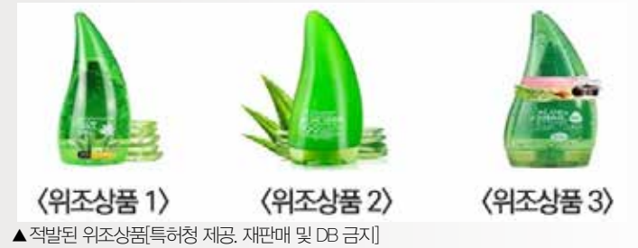
▲적발된 위조상품

특허청은 ‘해외 온라인 위조상품 재택모니터링단’이 지난해 8~12월 5개월간 위조상품 게시물 총 14만4천건을 적발해 4천200억원에 달하는 피해 예방 효과를 냈다고 19일 밝혔다. 모니터링단은 말레이시아, 베트남, 싱가포르, 인도네시아, 태국, 필리핀 등 아세안 6개국과 대만을 대상으로 위조상품 유통 대응을 강화하기 위해 출범했으며, 경력단절 여성과 다문화 가족 등 200여명으로 구성됐다. 이들은 아세안 온라인 쇼핑몰 1, 2위 업체인 라자다와 쇼피를 대상으로 위조상품 게시물을 모니터링했다. 적발된 게시물은 품목별로