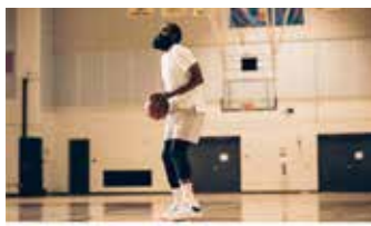
▲아디다스 하든 Vol.5의 제임스 하든

트래 영이 내년의 첫 시그니처 슈즈 출시 계획을 발표하고 난 하루 후, 아디다스가 NBA 스타 제임스 하든의 5번째 시그니처 슈즈 출시를 공개했다. 아디다스 하든 Vol.5는 아디다스가 기술력으로 무장한 최신 농구화로서 '퓨처내추럴(Future Natural)' 이라는 가장 주목할만한 기술을 적용했다. 아디다스에 따르면, 퓨처내추럴이란 "운동선수의 자연스러운