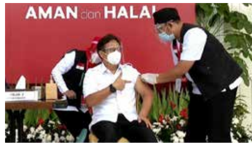
▲13일 시노백 백신 접종받는 보건부 부디 구나디 사디킨(Budi Gunadi Sadikin) 장관

많은 장소에 갈 때 건강인증서를 사용하게 되면 방역지침 시행에도 도움이 될 것” 이라고 말했다.