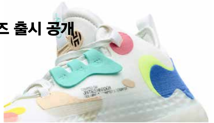
▲아디다스 하든 Vol.5의 어퍼

"하든 선수는 디자인과 착용감에 대해 피드백을 전달했으며 이는 우리의 크리에이티브 프로세스에서 매우 중요하게 사용됐다. 그리고 결과적으로 그의 경기 스타일과 일치하는 퓨처내추럴 기술을 개발할 수 있었다."