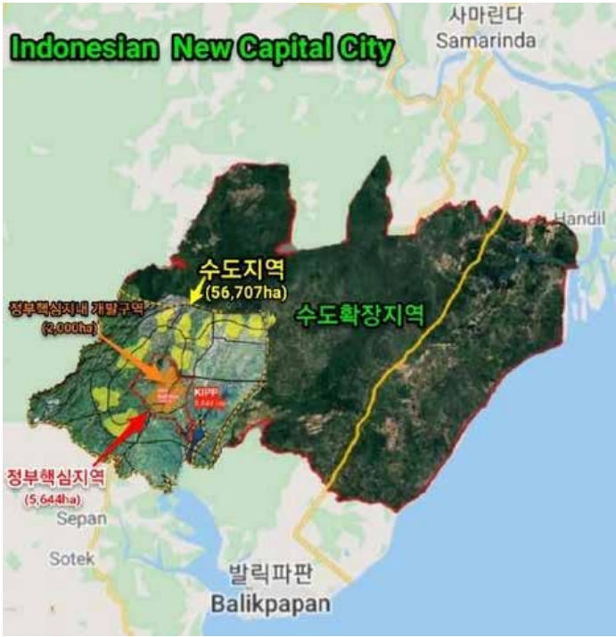
▲동부칼리만탄의 신수도 부지

인도네시아 정부가 2019년 8월 보르네오섬 동부칼리만탄에 신수도를 건설하겠다고 발표했으나 신종 코로나바이러스 감염증(코로나19) 백신 접종 국가프로그램이 완료된 뒤에야 착수할 전망이다. 25일 CNBC인도네시아, 신화통신 등에 따르면 수하르소 모노아르파 국가개발기획부(Bappenas) 장관은 최근 “백신 접종 프로그램 이후에 신수도 개발을 시작할 것이며 많은 일자리를 제공하게 될 것”이라고 말했다. 그는 신수도법안(IKN)이 올해 의회의 우선 처리 법안 목록에 포함됐고, 신수도 건설 조직 설립을 위한 대통령령이 이미 마련됐다고 밝혔다. 이어 “현재 인도네시아가 백신 프로그램에 집중하고 있기에 신수도 건설은 조코 위도