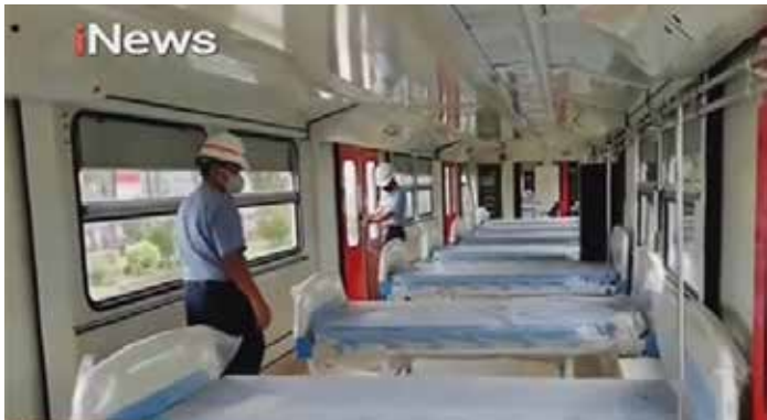
▲중부자바 주 마디운 시지방정부는 열차를 개조해 코로나19 병실로 사용하고 있다.

인도네시아 동부자바 주 소도시 마디운(Madiun) 시는 신종 코로나바이러스 감염증(코로나19) 병상이 부족해지자 열차를 응급 격리병원으로 동원했다.