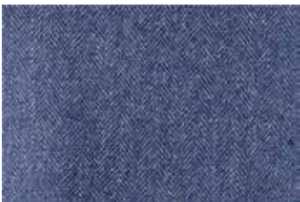
▲ 헤링본 패브릭

이 특별한 직조 방식은 마치 곡물과도 같아서, 한 곳에서 작게 마모가 발생하면 마모된 주변 부위의 트윌이 틈을 메워 구멍이 커지는 것을 막는다. 이 같은 속성 때문에 헤링본 패턴은 고대 이집트부터 사용됐다.