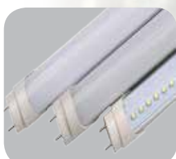
LED TUBE T8

한국부품을 사용해 수입품에 비해 가성비 극대화 인니 판매를 위한 SNI, TKDN, SUKOFINDO, ISO9001등 완벽한 인허가 적정 재고보유로 소량 및 대량주문에도 정확한 공급가능 현장 맞춤형 특수스펙제작 및 품질보증과 신속한 A/S