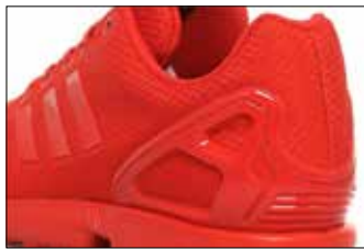
▲ 아디다스 ZX 플렉스 립스톤

전시 중, 립스톤을 포함한 나일론 패브릭의 수요가 기하급수적으로 늘어나 군에서 나일론 소재의 대다수를 소비하게 됐다. 그리고 종전 후에는 사용했던 수많은 낙하산을 우아한 드레스로 용도를 변경해 사용하게 됐다. 그리고 이후 아웃도어 산업과 레저 문화가 등장하면서 기능성 패브릭에 대한 수요는 점차 늘어 립스톤은 주로 의류로 사용하게 됐다.