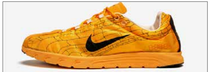
▲ 나이키 메이플라이

획기적인 나이키 메이플라이가 립스톤을 어퍼로 사용하면서 립스톤의 장점은 널리 알려지게 됐다. 아디다스의 테렉스 위프트 솔로(Terrex Swift Solo)도 강화 패브릭의