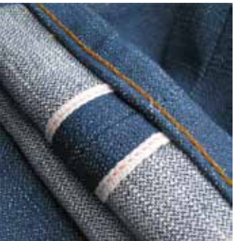
▲ 브로큰 트윌 데님

간단히 말해서, 립스톤이란 마모 확대를 방지할 수 있게 직조된 패브릭의 일종으로써 거친 환경에서 야외 활동을 하는 사람들을 위한 것이다. 실외 레저 활동을 즐기는 오늘날과는 달리, 이전 세대들은 이러한 종류의 획기적인 개발품을 연구하는 사람은 군용 개발자밖에 없었다.