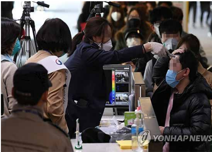
▲ 신종코로나에 금주 중국여행 100% 취소...국내 호텔들도 '비상' 신종 코로나바이러스 감염증인 '우한 폐렴' 공포가 확산하는 가운데 28일 28일 인천공항 제1터미널 입국장에서 중국발 항공기에서 내린 여행객들과 외국인들이 검역소에서 발열검사를 받고 있다.

주요 여행사, 다음달 예약까지 전액 환불...호텔도 열 탐지기·마스크 구비