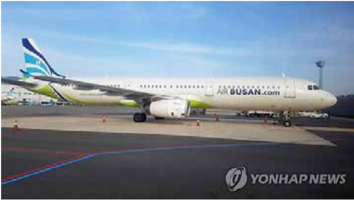
▲ 에어부산 비행기

저비용항공사 에어부산 [298690]이 올해 신규 항공기를 잇달아 도입하고 중거리 노선에 본격적으로 진출한다.