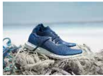
▲ 페어리 울트라부스트

팔리 슈즈 후속 모델에서는 이러한 자망을 회수해 아디다스 퓨처크래프트 내부에 사용할 수 있는 밑창으로 만들었다.