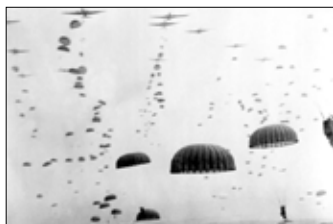
▲ WWII 파라트루퍼

미국 화학물질 회사 듀폰트(DuPont)은 새로 발견한 나일론 폴리머를 전시에 유용하게 사용할 수 있는 섬유로 개발했다. 그리고 이렇게 만들어진 섬유는 엄청난 압력이 가해져도 찢어지지 않는 낙하산 개발에 사용됐으며, 바로 이것이 립스톤의 기원이다. 그리고 오늘날의 립스톤의 패턴은 다이아몬드나 육각형처럼 다양하다.