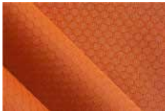
▲ 6각형 립스톤

전쟁이 발발하고 초기에, 전투원들이 낙하산처럼 실크줄을 매단 캐노피를 타고 적지에 뛰어내렸다. 실크는 가볍고 튼튼한 완벽한 소재지만 거친 전쟁 현장에서 사용하기에는 값비싼 직물이었다.