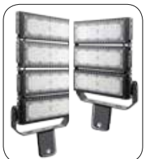
LED Module Light SSM