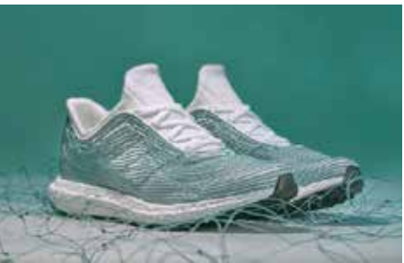
▲ 최초의 팔리 울트라부스트 (2015)

2015년 팔리가 아디다스와 파트너십을 체결한 이후, 지속 가능한 제조업의 포문을 열기 시작했다. 그리고 현재, 환경적으로 의식 있는 풋웨어 생산을 위해 NMD_CS1이라는 새로운 최고 수위선을 설정하고 있다.