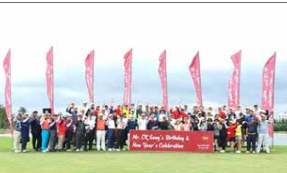
KMK GROUP 구정맞아 신년행사 가져 2020년 새로운 비전을 쏘아 올렸다.

Tel. 021-3002-9091 E-mail : indokofa@gmail.com Add : Jl. Imam Bonjol No. 75 Cibodas - Tangerang