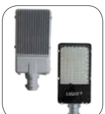
LED Street Light SSE