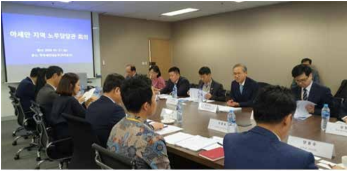
▲ 자카르타서 ‘아세안 지역 노무 담당관 회의’

아세안 6개국 고용 · 노동 담당관 회의...인니 · 베트남에 고충전담반 “노사분규, 현지법 따르는 것 원칙이나 국익 고려해 정부 대응”