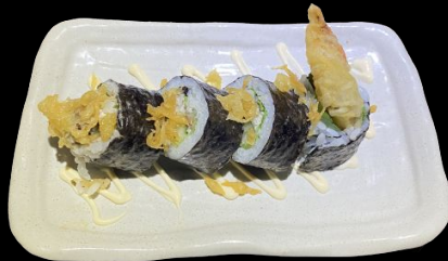
スパイダーロール Spider Roll