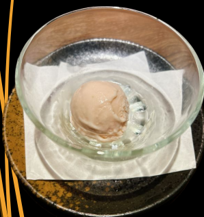
高知産イチゴ アイスクリーム Kochi ichigo ice cream