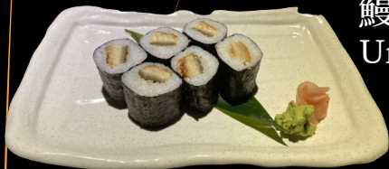
鰻巻き Unagi Maki