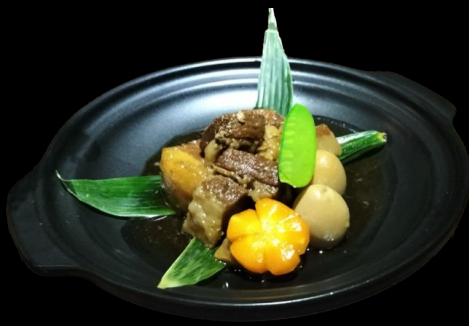
豚角煮 Buta Kakuni Sweet Stewed Diced Pork