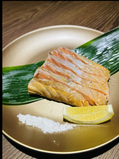
サーモン藁焼き Salmon Warayaki Grilled Salmon Sashimi