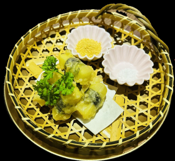
チーズ天 Cheese Tempura