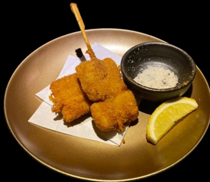
スペイン豚串カツ Spain Buta Kushikatsu Pork Thigh Katsu