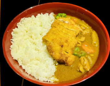
チキンカツカレー Chicken Katsu Curry