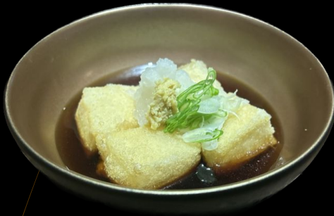
揚げだし豆腐 Agedashi Tofu Fried Tofu with Sauce