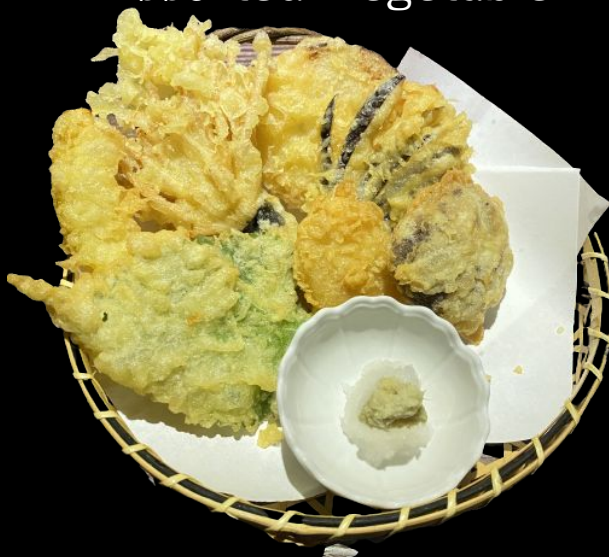
野菜天ぷら盛り合わせ Yasai Tempura Mori Assorted Vegetable Tempura Rp 65k