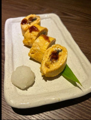
特選 う巻き卵 Umaki Unagi Rolled by Grilled Egg