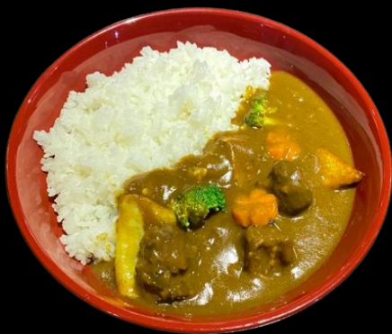
豚カレー Buta Curry Pork Curry