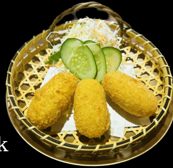
コーンクリーム コロッケ Corn Cream Croquette