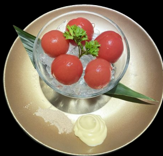
冷やしトマト Hiyashi tomato Cold Tomato