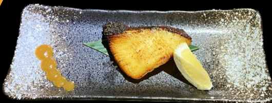
シマアジ西京焼き (京都風) Shimaaji Kyoto Saikyo Yaki Kyoto Style Miso Grill Striped Jack