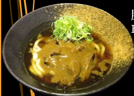
豚カレーうどん Buta Curry Udon