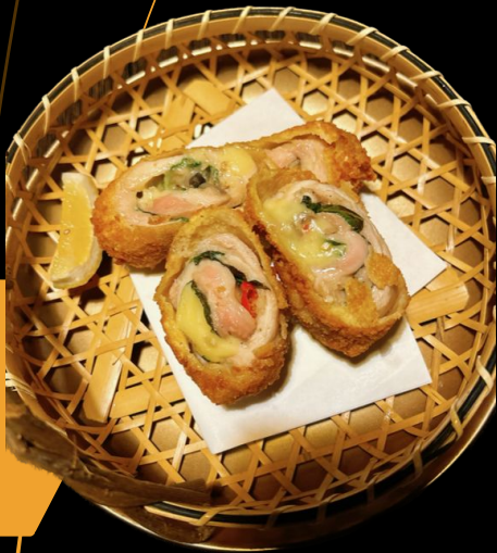
サンバルマタ 鴨チーズ巻 Sambal Matah Cheese Roll with Duck