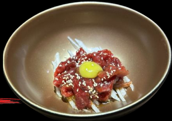
牛赤身ユッケ Gyu Akami Yukke Beef Sashimi