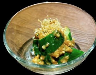
にんにく梅きゅう Ninniku Ume Kyu Ume Marine with Cucumber