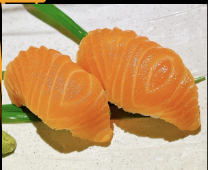
サーモン寿司 Salmon Sushi