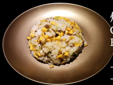
焼き飯(牛・豚) Gyu Yakimeshi Beef fried Rice