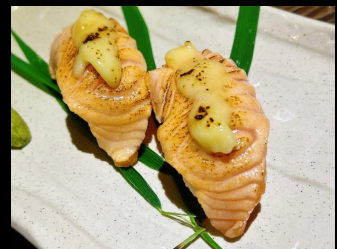
サーモンチーズ炙り寿司 Salmon Aburi Cheese Sushi