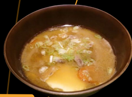
豚汁 Tonjiru Miso Soup with Pork & Vegetable