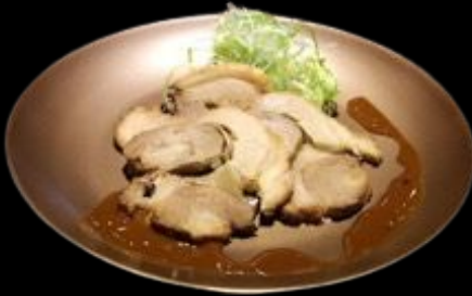
こだわり焼豚 Kodawari Chasyu Slice Grilled Pork