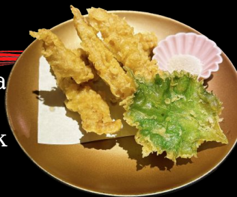
合鴨ササミ天 Aigamo Sasami Ten Duck chest Tempura