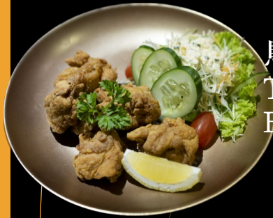
鳥唐揚げ Tori Karaage Fried Chicken