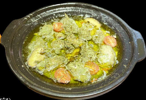
牡蠣のアヒージョ Kaki Ajillo / Oyster Ajillo