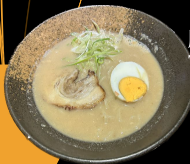
豚骨ラーメン Tonkotsu Ramen