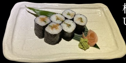
梅しそ巻き Ume shiso Maki