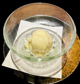
高知カシューナッツ アイスクリーム Kochi Cashew nuts ice cream