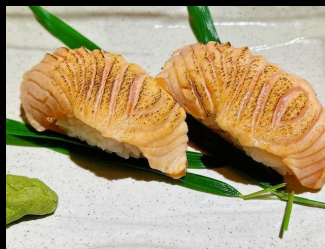
サーモン炙り寿司 Salmon Aburi Sushi