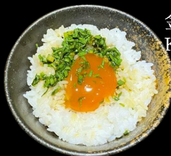
金の卵めし Kin no tamago meshi