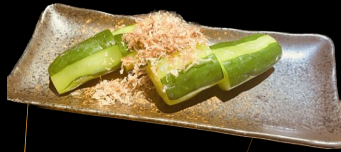
一夜漬けきゅうり Ichiyazuke Kyuri Pickled Cucumber