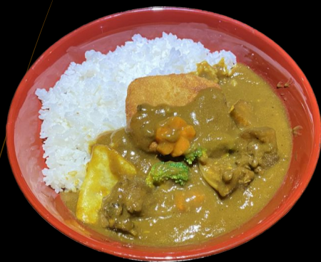
ヒレカツカレー Hire Katsu Curry Pork Fillet Curry