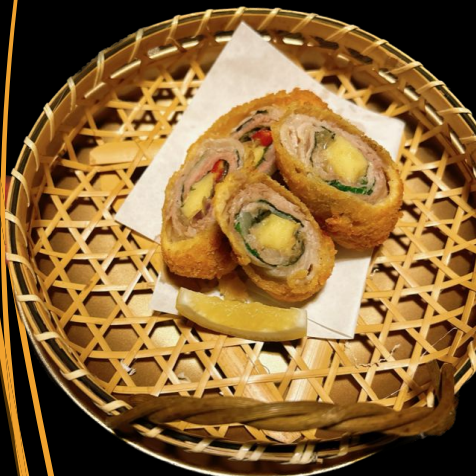
サンバルマタ 豚チーズ巻 Sambal Matah Cheese Roll with Pork