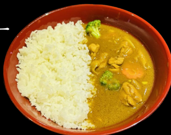
チキンカレー Chicken Curry