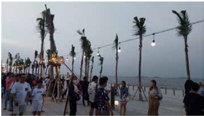
▲북부 자카르타 PIK2

정부는 민간 기업이 자금을 지원하는 14개의 새로운 국가전략프로젝트(PSN)를 발표했으며 올해 공사가 시작될 예정이다.