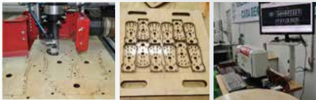
철판,아크릴, 합판, 뼈그라이트등 레이저커팅