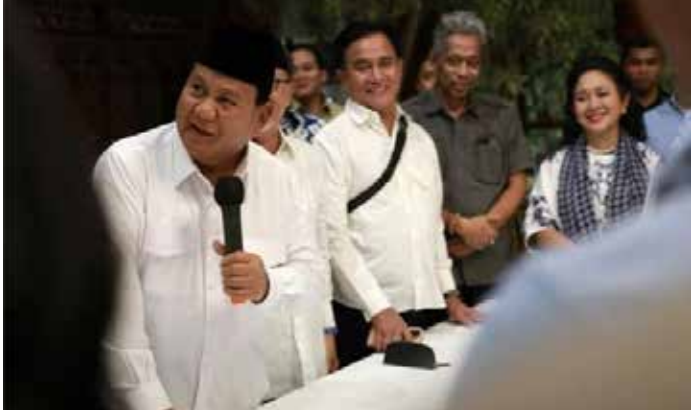
▲프라보워 수비안토(왼쪽)

지난달 14일 치러진 인도네시아 대통령 선거에서 프라보워 수비안토 후보가 과반을 득표해 승리했다고 선거관리위원회(KPU)가 20일 발표했다.