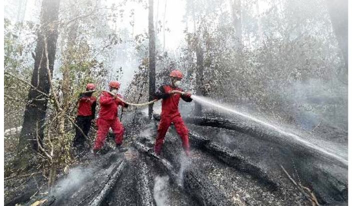
▲산불진화 모습

산불에 취약한 지역은 리아우, 남부 수마트라, 람방, 잠비, 그리고 남부 및 중부 칼리만탄이 지목됐다. 이 지역들은 대규모 팜유 농