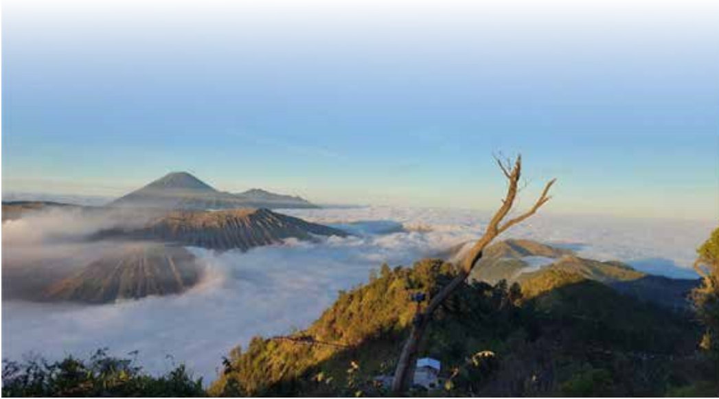
▲ 동부자바의 브로모 산

개발과 필요에 따라 인도네시아의 투자는 농업, 광업, 제조업과 같은 전통적인 부문에만 국한되지 않는다. 하지만 정보 기술, 재생 에너지, 스타트업과 같은 혁신적인 분야로 점점 더 확대되고 있다.