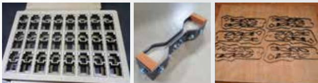
종이, 고무, 가죽, 스폰지,아스테이지, PC, 필름등 모든 자재 커팅금형의 최적금형의 대명사 "톱슨 목금형"

우수한 첨단장비로(CAD, Laser, Auto Banding)최상의 톱슨 목형을 제공하여 신속성, 정밀성, 경제성 이 월등하며 신발, 자동차부품, 전자부품 절단, 생산하는데 최상의 칼 금형