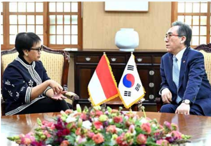
▲조태열 외교부 장관과 레트노 마르수디 인도네시아 외교장관이 18일 오후 정부서울청사에서 ‘제3차 민주주의 정상회의’ 계기로 만나 두 번째 회담을 가지고 있다.

조태열 외교부 장관은 18일 ‘제3차 민주주의 정상회의’ 장관급회의 참석차 한국을 방문한 레트노 마르수디 인도네시아 외교장관과 취임 후 두 번째 회담을 개최했다. 외교부에 따르면 이날 조 장관은 인도네시아가 세계에서 세 번째(인구 기준)로 큰 민주주의 국가이자 2008년 이래 발리 민주주의 포럼을 개최하는 등 민주주의에 대해 기여해 오고 있다고 평가했다.