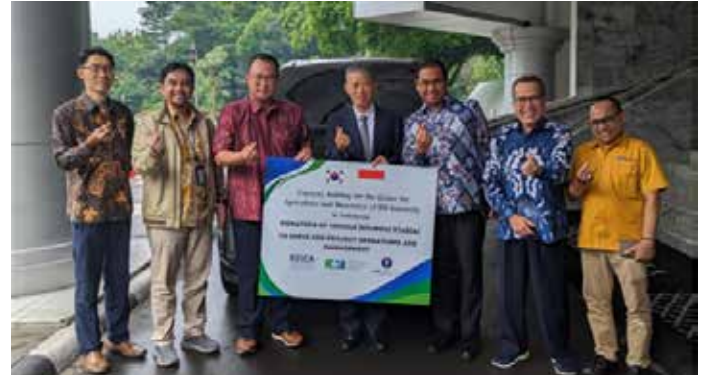
▲2024년 3월 14일 인도네시아 보고르대학교에서 차량 기증식에서 참석자들이 차량 앞에서 기념 촬영을 하고 있다.

코이카, 인도네시아 농업생명과학분야 교육 및 연구 역량강화 지원 차량 기증을 통한 원활한 사업 운영과 보고르대학교와의 우호관계 증진