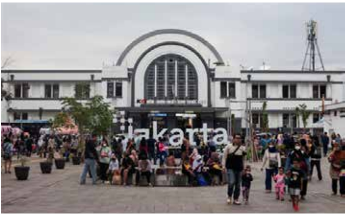
▲자카르타 꼬따 기차역

깔리만탄의 신수도 누산파라로 국가 행정기능이 옮겨가도 국회는 자카르타에 남겨 자카르타를 ‘입법도시’로 만들자는 일단의 국회의원들 제안이 결국 받아들여지지 않았고 19일 자카르타포스트가 보도했다.