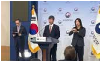
▲3월 7일 서울 종로구 정부서울청사 별관에서 열린 외교부와 재외동포청 합동 브리핑에서 이기철 재외동포청장이 2024년 주요 업무 추진계획을 발표하고 있다.

재외동포에게 근본적인 이익 주며 파급효과가 큰 사업과 민생·현장 중심 사업 추진 핵심 사업은 한국 발전상의 외국 교과서 수록 프로젝트