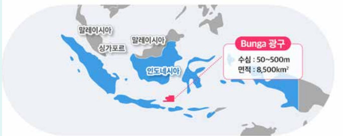
▲포스코인터내셔널은 인도네시아 붕아 광구의 3D 지진 조사 수행 업체를 찾기 위해 입찰을 진행한다.

포스코인터내셔널(이하 포스코인터)이 인도네시아 붕아(Bunga) 광구의 3차원(3D) 인공 지진파 탐사를 통해 유망성을 평가한다. 포스코인터는 광구 탐사 후 오는 2027년 탐사 시추를 최종 결정할 예정이다.