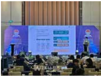
▲이에이트가 2023인도네시아공간정보해외진출로드쇼에 참가했다.

제조 산업을 넘어 공공·건설 등 다양한 분야에서 디지털 트윈(Digital Twin) 기술이 활용되고 있다. 시뮬레이션과 모니터링 등이 가능한 디지털 트윈은 생산성 향상 등에 도움이 될 수 있다. 국내 디지털 트윈 선도기업 이에이트는 지난달 29일부터 이틀간 인도네시아 자카르타에서 해외 시장 진출을 위한 네트워킹을 확대했다고 1일 밝혔다. 2023인도네시아공간정보해외진출로드쇼 참가... 주력 제품 NFLOW 등 소개 [인더스트리뉴스 조창현 기자] 제조 산업을 넘어 공공·건설