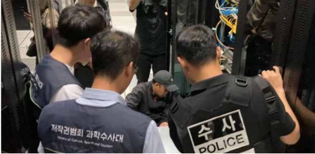
▲인도네시아 현지 압수수색 [부산경찰청 제공]

국내 방송과 영화 등을 인도네시아 교민들에게 불법 송출해 업계 추산 160억원 이상의 피해를 준 일당이 당국에 적발됐다. 부산경찰청 사이버범죄수사대는 최근 저작권법 위반 혐의로 해외 IPTV 운영 총책 A씨 등 2명을 구속하고 1명을 불구속 입건했다고 4일 밝혔다. A씨 등은 2015년부터 올해 10월까지 9년간 정당한 저작권 계약 없이 국내의 방송과 영화 등을 인도네시아로 불법 송출한 후 현지 교민 1천700여명에게 유료로 제공한 혐의를 받는다. 이들은 국내 실시간 방송콘텐츠에 대한 교민들 수요가 많지만, 해외에서 접근성이 떨어지는 점을 노려 인도네시아 현지와 국내에서 각자 역할을 나눠 범행을 벌인 것으로 드러났다. A씨는 인도네시아에서 ‘티브이O’라는 상호로 IPTV 업체를 운영하면서 원격 조종을 통해 국내·외 72개 채널의 실시간 방송과 주문형 비디