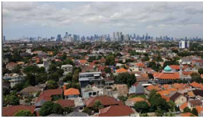
▲남부 자카르타 주택가 전경

서 은행가들이 패러다임의 전환이 필요하며, 급여 명세서가 있는 사람들에게만 주택담보대출을 제공해서는 안 된다며 정부가 은행이 인식하는 위험을 보장할 수 있어야 한다고 말했다.