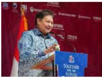
▲아이르랑가 하르파르도 경제조정장관이 30일 자카르타 몰리아호텔에서 열린 한-인니 수교 50주년 포럼에서 기조연설을 하고 있다.

“인도네시아가 높은 사업 수익성이 있는 산업 부문에 한국 투자자를 유치하려고 노력하고 있다” 아이르랑가 하르파르도 인도네시아 경제조정장관은 30일 자카르타 몰리아호텔에서 열린 한-인니 수교 50주년 협력 포럼에서 한국 기업이 현지에서 높은 수익을 내고 있다며 이같이 말했다.