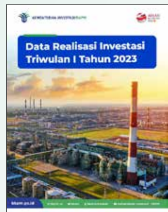
▲[자료사진] BKPM 제공

올해 상반기 외국인투자와 내국인투자를 합한 금액은 678.7조 루피아이며, 전년 동기 대비 16.1%가 증가했다. 바흐릴 라하달리아 투자부 장관은 이날 기자회견에서 “올해 목표의 48.5%를 달성했다. 올해 목표 금액인 1,400조 루피아를 달성할 수 있을 것으로 낙관한다”고 말했다. 이 기간 총 투자 금액 가운데 외국인직접투자(FDI)는