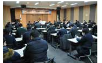
▲해외건설협회 '제47회 정기총회' 전경.

하고 사전타당성 검증강화 등 개선방안을 마련해 사업평가시 반영할 예정이다. 제안서 마감후 검토와 자문위원회 심의를 거쳐 내년 2월 신규후보사업을 확정할 계획이다. 해건협 측은 “ODA사업 전담기관으로서 내실있는 성과 도출을 위해 국내 인프라개발 경험을 수원국과 적극 공유할 것”이라며 “이를 토대로 국내기업의 해외건설시장 진출이 활발해