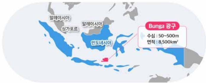
▲인도네시아 Bunga 광구 위치

포스코인터내셔널이 서울의 14배 크기에 달하는 인도네시아 대형 광구 운영권을 확보하고 원유·가스 분배 계약을 체결했다. 포스코인터내셔널은 25일 인도네시아 땅그랑시에서 인도네시아 정부 기관, 국영 석유회사 페르타미나 홀루 에너지(PHE)와 Bunga 광구의 ‘생산물 분배 계약’을 체결했다고 밝혔다. Bunga 광구는 인도네시아 자바섬 동부 해상에 위치한다. 총면적만 8,500km²로 서울의 14배 크기에 달한다. 수심은 50m 천해부터 500m 심해까지 포함하는 대형 광구다. 이번 계약으로 포스코인터내셔널은 Bunga 광구 운영권을 포함해 기본 6년의 탐사 기간과 30년의 개발 및 생산 기간을 보장받는다. 인도네시아 정부와 계약자인 포스코인터내셔널·PHE 간 생산물 분배 비율은 원유의 경우 60대 40, 가스는 55대 45로 확정됐다. 전체 생산량의 25%는 인도네시아 현지에 의무 공급해야 하며,