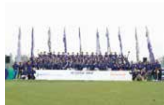
▲행사 사진_기념 촬영

HD현대건설기계 인도네시아 법인은 지난주 금요일(7월 7일) 고객 초청 행사(2023 현대 골프 토너먼트)를 개최했다. 인니 딜러사 United Equipment Indonesia와 공동으로 주최한 이번 행사는 지난해에 이어 2회차 행사로, 1회차와 동일하게 자카르타 PIK 지역에 위치한 Damai Indah 골프장에서 진