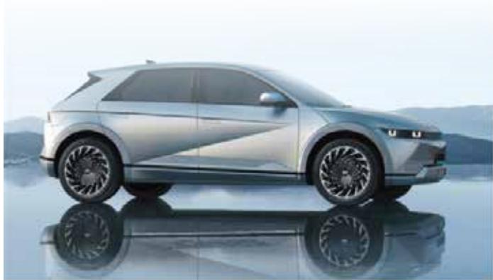
▲현대자동차 인도네시아 공장에서 생산한 전기차 아이오닉5

현대자동차그룹은 2024년 8월부턴 인도네시아 현지 공장에서 생산한 배터리 팩을 장착한 아이오닉 5 등 전기차를 생산할 예정이며, 이를 통해 막대한 전기차 세계 혜택을 받을 수 있도록 생산량을 늘릴 계획이다. 이영택 현대차 아태권역본부장은 25일 서울 한 호텔에서 열린 ‘한-인도네시아 수교