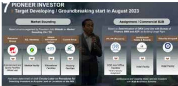
▲오는 8월 착공을 할 예정인 위락시설, 병원, 학교 호텔 등 6개 주요 민간 부문 사업

스마트 산림도시’ (Future Smart Forest City)로 구축된다. 인도네시아 신수도청은 최근 ‘21세기 지속 가능한 스마트 열대우림 도시 콘셉트로 2045년 탄소중립 도시가 될 것’ 이라고 발표했다. 해외 투자 유치를 위한 세계 혜택과 외국인 체류 인센티브 제공 인도네시아의 신수도 이전 사업은 약 340억 달러가 소요되는 대규모 사업이다. 총 소요 자금 가운데 인도네시아 정부 예산은 약 20%가 투입되고, 나머지 80%는 민간 투자