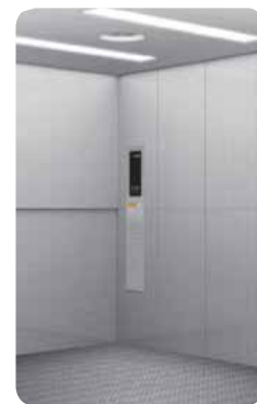
화물용엘리베이터 FREIGHT ELEVATOR