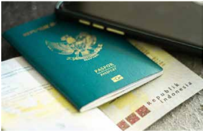
▲[자료사진] BKPM 제공

인도네시아인들은 짧은 해외 여행을 떠나려 해도 비자 신청과 발급에 훨씬 더 오랜 시간을 소비하는 경우가 종종 생긴다.