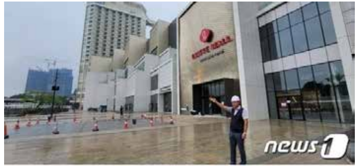
▲베트남 하노이에 조성되는 롯데몰 웨스트레이크 하노이 전경. 2023. 7. 20.

잇따른 국내 건설사의 해외 수주로 국내 건설사들의 늘어나는 국외 파견 수요에 대응하기 위해 31일부터 정부가 해외 건설 현장에서 1년 이상 근무한 근로자에게 주택 청약 특별공급 기회를 제공한다. 국토교통부에 따르면 국외에서 1년 이상 근무한 근로자에게 85㎡ 이하의 민영주택에 대한 특별공급 기회를 부여하는 내용의 '주택공급에 관한 규칙 개정안'이 이날부터 시행된다.