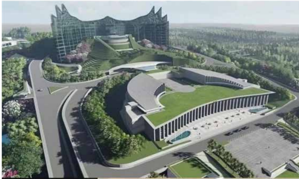
▲신수도 누산타라 정부 청사 조감도 [자료사진]

이날 설명회에서 발표한 신수도 누산타라 사업의 진행 현황은 다음과 같다. 조코 위도도 정부는 2019년 8월 자바섬의 인구·경제 집중 현상과 환경문제 등을 해결하고 국토의 균형 발전을 도모하기 위해 수도 이전을 발표했다. 코로나19 팬데믹으로 수도 이전 사업의 진행이 지연되기도 했으나, 관련 법규정을 마련하고 2022년 3월 밤방 수산포노 신수도청장을 임명하고 본격적으로 이전 사업을 진행하고 있다. 2045년 최종 완공을 목표로 추진 중인 신수도 누산타라의 면적은 25만6000헥타르로 자카르타보다 4배 더 넓다. 인도네시아는 신수도 사업을 통해 국내외 투자를 유치해 신성장동력을 확보하고, 동시에 탄소중립 정책 실현을 목표로 하고 있다. 인도네시아 신수도 이전 사업은 4단계로 이루어질 계획이다. △1단계(2020~2024년)는 법규정 마련, 주요 인프라 구축(주거단지, 전력, 수도, 도로), 공무원 이전(인구 20만명), 2024년 독립기념일 이전에 대통령궁 건립 완료 등이다. △2단계(2025~2035년)는 주요 경제 인프라 구축 완료, 중앙 행정부 구축 △3단계(2036~2045년)는 광역도시 구축 및 순환경제 시행을 위한 네트워크 마련 △4단계(2045년 이후)는 세계 10대 도시 진입(인구 190만명 이상), 탄소 배출 제로 달성 및 100% 신재생에너지원 구축 등이다. 신수도는 ‘미래형