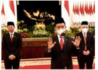
▲바흐릴 라하달리아 인도네시아 투자부 장관 2023.08.04.