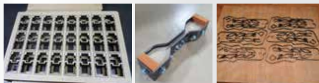
종이, 고무, 가죽, 스폰지,아스테이지, PC, 필름등 모든 자재 커팅금형의 최적금형의 대명사 "톱슨 목금형"

우수한 첨단장비로(CAD, Laser, Auto Banding)최상의 톱슨 목형을 제공하여 신속성, 정밀성, 경제성이 월등하며 신발, 자동차부품, 전자부품 절단, 생산하는데 최상의 칼 금형