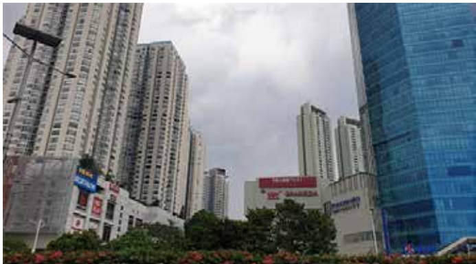
▲자카르타 서부의 따만 앙그렉 추상복합 아파트

부동산 컨설턴트들은 주민들이 대중교통중심개발(TOD) 지역 내 주택에 대한 전망을 간절히 기대하고 있다고 보고하지만, 이러한 아파트는 가격이 적당하고 공공 인프라가 완공된 경우에만 구매자를 찾을 수 있다.