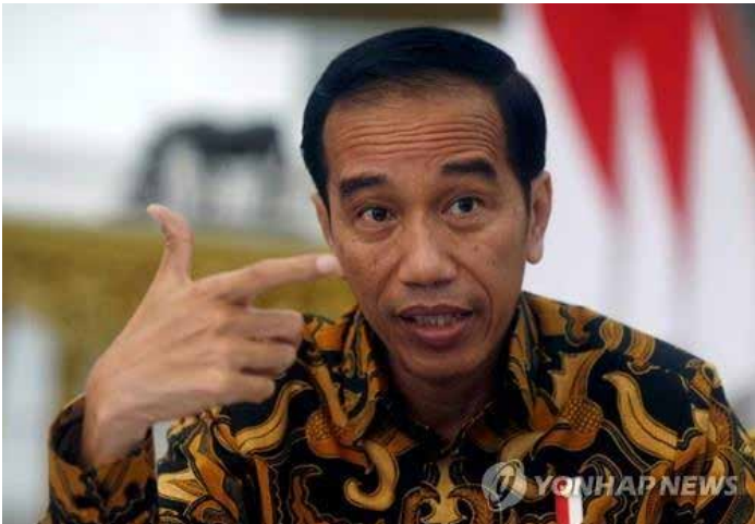
▲ 조코 위도도 인도네시아 대통령.

조코 위도도(일명 조코위) 인도네시아 대통령이 신종 코로나바이러스 감염증(코로나19) 확산을 제대로 막지 못했다는 일부 비판에 적극적으로 반박하고 나섰다.