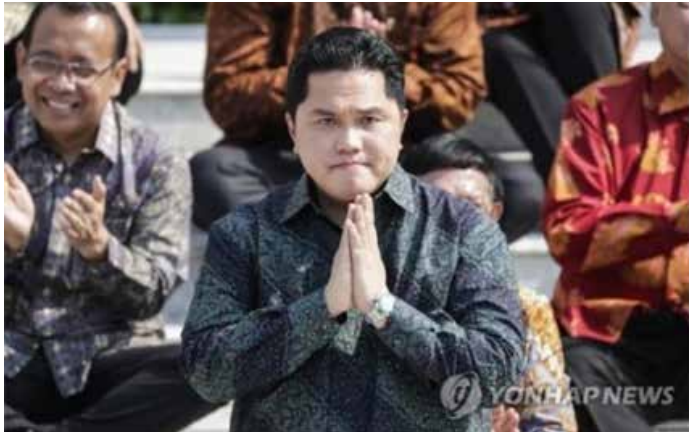
▲ 에릭 토히르 인도네시아 국영기업부 장관

인도네시아 국영기업부 장관과 투자조정청장이 LG화학과 현대차의 인도네시아 배터리 공장 설립 문제를 담판 짓기 위해 서울을 방문했다.