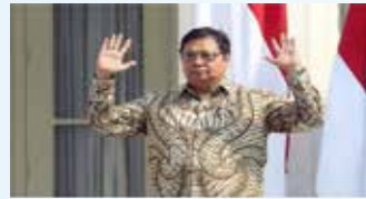
▲ 인도네시아 아이들랑가 하르따르도 경제조정장관

현지 언론 펠렐 28일자 보도에 따르면 아이들랑가 경제조정장관은 “정부는 백신 접종에 관한 대통령령 및 로드맵을 수립 중이다. 가까운 시일