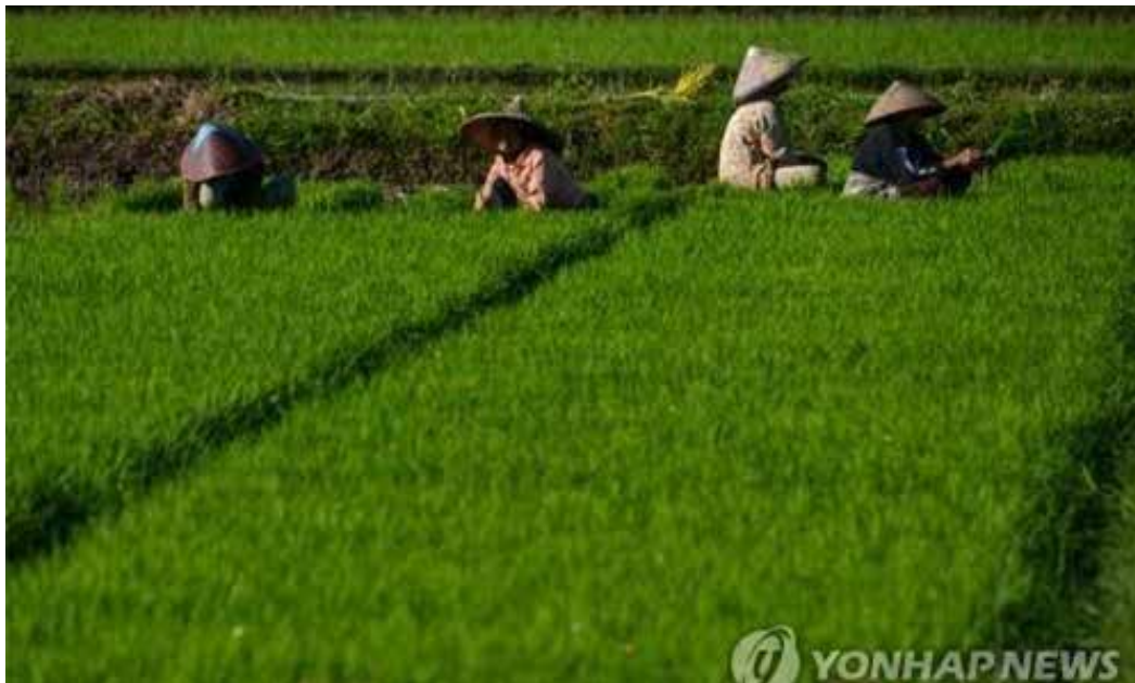
▲ 인도네시아 '싱가포르 10배 크기' 경작지 개발 사업 착수

인구 2억7천만명의 인도네시아가 '식량 안보'를 지키겠다고 싱가포르 면적 10배 크기의 경작지 개발 사업에 본격 착수했다. 24일 인도네시아 대통령궁 등에 따르면 조코 위도도 대통령은 전날 주재한 국무회의에서 "14만8천ha는 쌀 경작 논으로, 62만2천ha는 옥수수과 카사바 등 다른 농작물 재배지로 조성하는 사업을 시작했다"고 발표했다. 조코위 대통령은 "보르네오섬 중부 칼리만탄과 수마트라섬 북부에서 시범 사업을 시작하고, 이후 서파푸아, 동누사 가라, 남수마트라로 확대할 것"이라고 설명했다. 이어 "경작지에 도로 연결, 인프라를 지원해 현대식 대형 농기