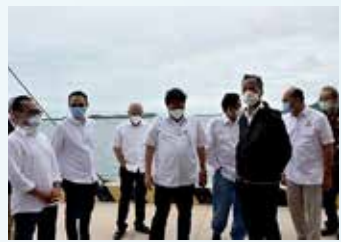
현재 국내의 보크사이트 연 생산량은 약 4,000만톤에 달한다. 보크사이트를 알루미늄아

로 내걸었다. 아이들랑가 경제조정장관은 26일 갈랑 바땅 경제특구를 시찰해 알루미늄아 제련소 및 발전소 등의 건설 현장을 살펴봤다. 아이들랑가 장관은 "보크사이트를 국내에서 SGA로 가공하여 수출할 수 있게 돼 기대가 크다"라고 언급했다.