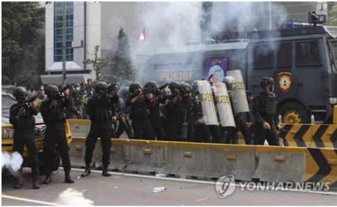
▲ 인니 경찰, 8일 자카르타 시위대에 최루탄 · 물대포 동원

인도네시아에서 노동법 개정 등을 골자로 한 ‘옵니버스법’ 반대 시위가 일부 지역에서 격화되자 경찰이 물대포와 고무탄, 최루탄을 동원했다.