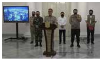
▲ 9월 13일 아니스 바스웨단 자카르타 주지사는 기자회견 모습

규모사회적 제약 전환기의 새로운 규정에 따라 영화관, 식당 등이 재개된다. 식당, 카페 등은 매장 내 최대 50%만 허용되며 테이블 거리 1.5미터를 유지하고 매장 운영시간은 오전 6시부터 21시까지 허용된다. 안뜰, 라구난, 따만미니와 같은 공원의 경우 최대 25%까지 허용되며 오전 8부터 17시까지 운영된다. 미용실 등도 수용인원의 50%만 허용하며 오전 9시부터 21시까지, 관중이 없는 운