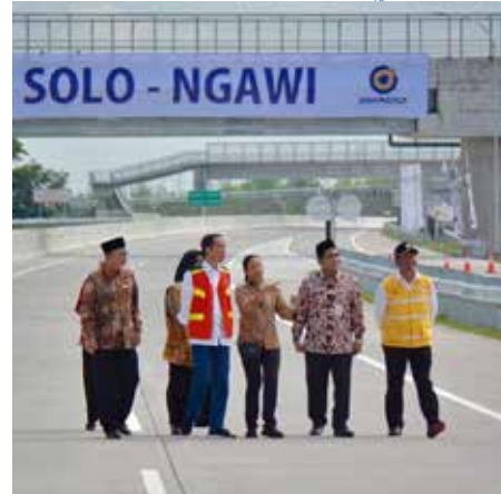
▲ 수라까르따(솔로)-응아위 고속도로 중 스라켄-응아위 구간 개통식에 참석한 조꼬위 대통령. 2018.11.27

조꼬위 대통령은 28일에는 리니 수마르노 국영기업장관과 함께 중부자바 수라까르따-응아위 고속도로 가운데 스라켄-응아위 구간 개통식에 참석했다. 길이 51km의 이 구간은 크게 트란스자바 고속도로의 일부다.