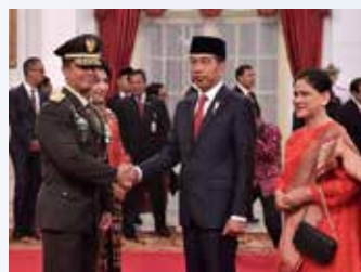
▲ 조코위 대통령이 신임 안디카 빠르까사 육군참모총장과 악수를 하고 있다. [조코위 대통령 공식 페이스북 계정]

하지만 이번 지시는 외국인 고용조건을 완화하고 있는 정부의 정책에 위배된다. 올해 초에 인