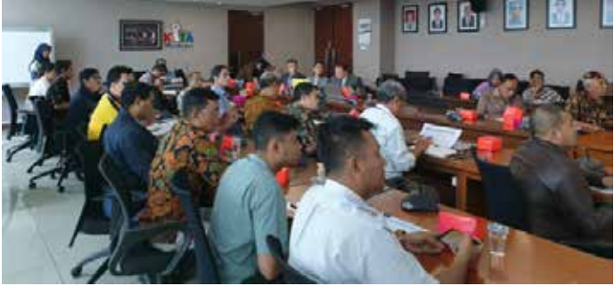
▲ 한국CM협회와 인도네시아 현지 국내업체들과 인니 시범사업 현장조사 보고회 전경