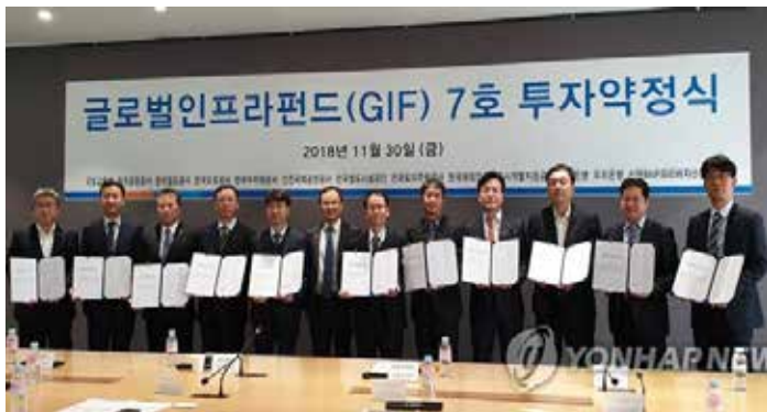
▲ 30일 서울 여의도 해외인프라도시개발지원공사에서 열린 '글로벌인프라펀드 7호 투자약정식'에서 국토교통부와 한국공항, LH 등 인프라 공기업과 신한은행, 우리은행 등 민간기업 관계자들이 기념촬영을 하고 있다. 2018.11.30

국토교통부는 해외 인프라 도시개발사업을 지원하기 위한 마중물 역할을 하는 정책펀드인 글로벌인프라펀드