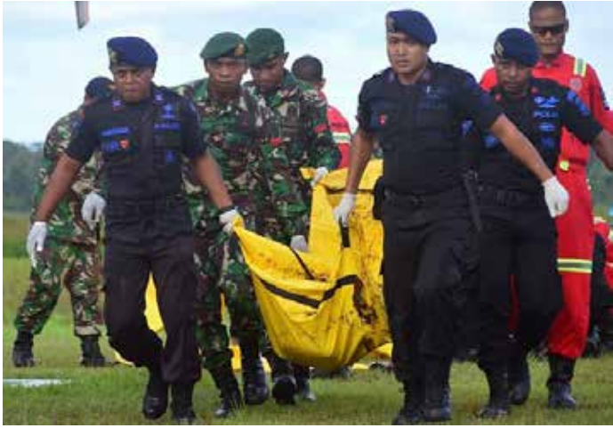
▲ 2018년 12월 7일 인도네시아 군경이 파푸아 주 띠미카 지역에 도착한 국영건설사 소속 근로자들의 시신을 옮기고 있다.

인도네시아 파푸아 주에서 건설 노동자 19명을 살해한 분리주의 반군이 인도네시아 정부에 독립이나 자치권 확보를 위한 협상을 요구하고 나섰다. 9일 일간 자와 포스 등 현지 매체와 외신에 따르면, 파푸아 분리주의 단체인 자유파푸아 운동(OPM) 산하 무장조직 서 파푸아해방군(TPNPB)의 세비 삼본 대변인은 언론 인터뷰를 통해 인도네시아 정부와의 평화협상을 요구했다. 인도네시아에서 독립한 동티모르나 자치권을 얻어낸 서부아체 주처럼 파푸아 원주민들에게도 민족자결권을 보장해야 한다는 주장이다. 그는 “아체와 동티모르가 그런 기회를 가졌다면 왜 우리는 안 되느냐”면서 “우리는 발전이 필요하지 않다. 우리에게 필요한 것은 독립”이라고 말했다. 앞서 이 단체는 이달 1일 파푸아 주 은두가 리젠시(군·郡)의 파푸아항단도로 건설 현장을 공격해 타 지역 출신 건설 근로자 19명을 살해했다.