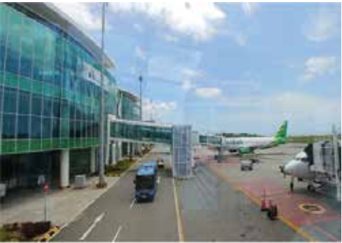
▲ 발릭빠반 스벵간 국제공항.

자카르타에서 여객기로 2시간만에 도착한 동부칼리만탄 주 발릭빠반 시 스벵간 국제공항에 도착했다. 2014년 완공한 스벵간 국제공항터미널은 연간 1천명의 여객을 소화할 수 있는 현대식 건물로 지어졌다.