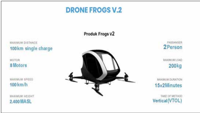
▲ 인도네시아 자체 개발 드론 택시 ‘Frogs 282’ [프로그즈 홈페이지]

인도네시아 족자카르타(욕아 카르타)에서 7일 드론 택시가 첫 시험 비행을 했다고 현지 매체들이 9일 보도했다.