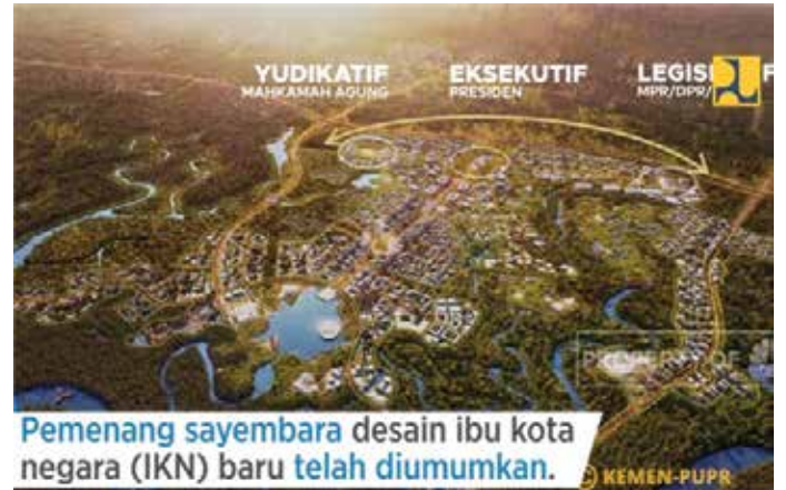
▲ 신수도 조감도