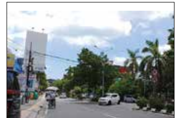
▲ 거리가 깨끗한 발릭빠반 시.

이 곳에서는 신수도 예정지가 한눈에 볼 수 있다. 멀리 우측에 코린도 사업장과 가운데 신수도 청사가 들어갈 지역이 눈에 들어온다. 더 멀리 지평