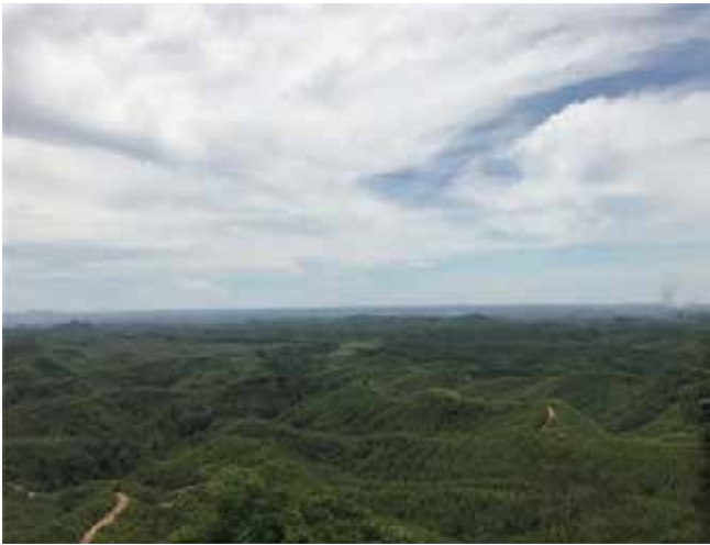
▲ 스빠꾸 ITCI 조림지에서 바라본 신수도 예정지.

인도네시아에서 깨끗하고 소득이 높은 도시로 알려진 발릭빠반은 우리에게 익숙한 도시다. 시내에서 스피드보트를 타고 20