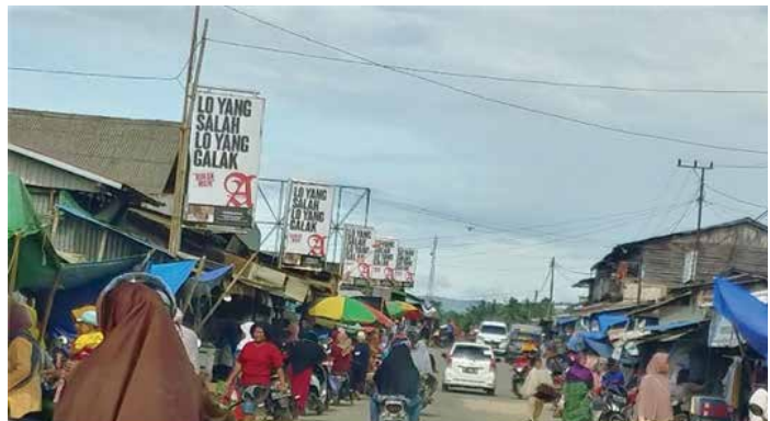
▲ 분주한 스빠꾸 시장

천연림이 펼쳐진 동부칼리만탄은 천연목 벌채 사업과 합판사업, 석탄광산과 오일팜 사업 등 자원사