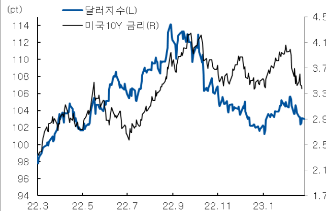
미국 국채 금리와 달러 지수 추이