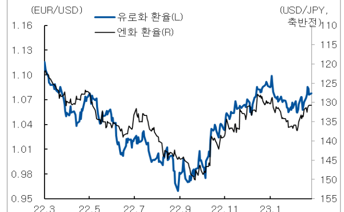
유로화와 엔화 환율 추이