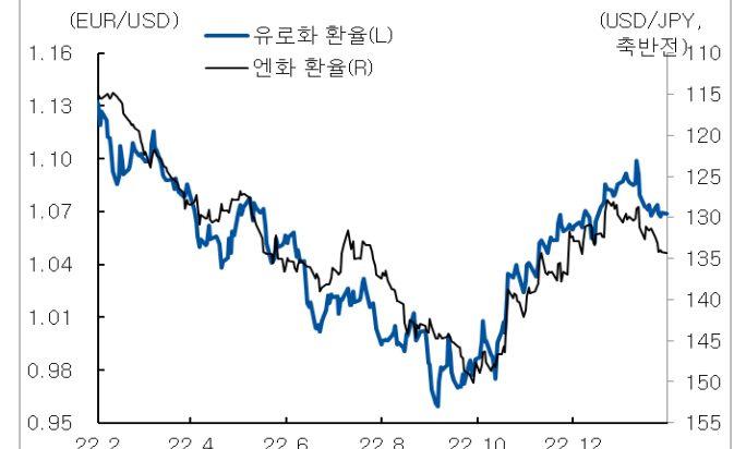
유로화와 엔화 환율 추이