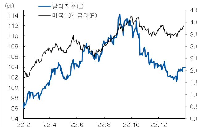
미국 국채 금리와 달러 지수 추이