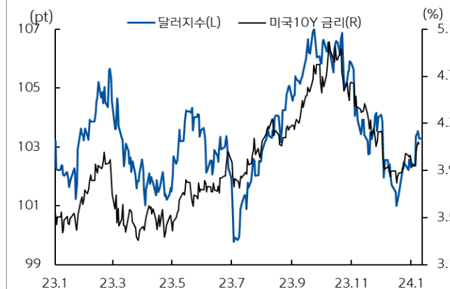
미국 국채 금리와 달러 지수 추이