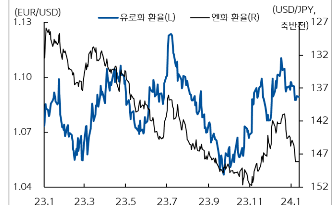
유로화와 엔화 환율 추이