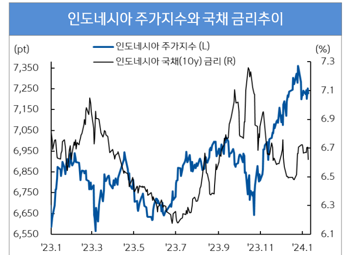
자료 : Bloomberg, 신한은행 S&T센터