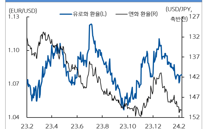
유로화와 엔화 환율 추이