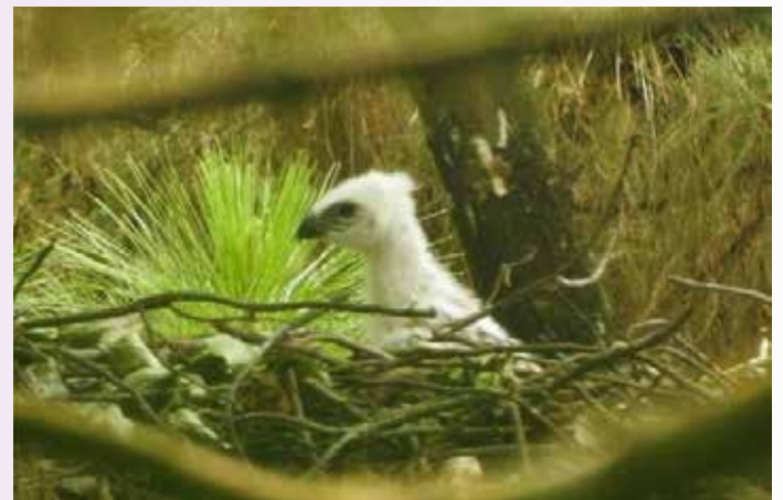
▲인니 국경일에 ‘자바독수리’ 새끼 공개...특별한 선물

인도네시아 국장(國章)에 새겨진 신화 속의 새 ‘가루다’의 모델인 멸종위기종 자바독수리 새끼가 현지 국경일에 맞춰 모습을 드러내 화제다.