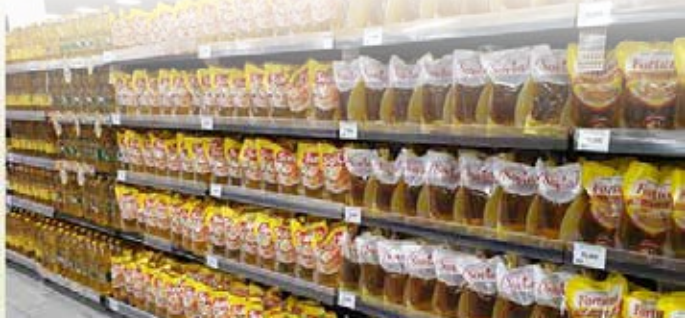
▲ 대형수퍼에서 판매하는 프리미엄 포장식용유

인도네시아 무역부는 정부 목표인 리터당 14,000루피아까지 식용유 가격을 낮추기 위해 보조금을 받는 대용량 식용유 유통 메커니즘을 상세히 기술한 규정을 25일 발표했다.