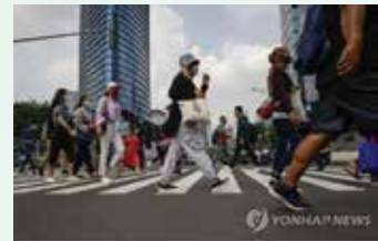
▲인도네시아 수도 자카르타 시내 모습

마르다니 총재는 공무원 보수체계를 개선해야 한다고 하며, 기본급을 올려야 공무원들이 각종 수당과 공무상 여비에 목을 매지 않는다고 말했다. 그는 특히 공무원 준비생과 밀레니얼·Z세대 공무원은 과거의 공무원들과 원하는 보수 수준이 다르고, 직업에 대한 기대감도 다르다며 낮은