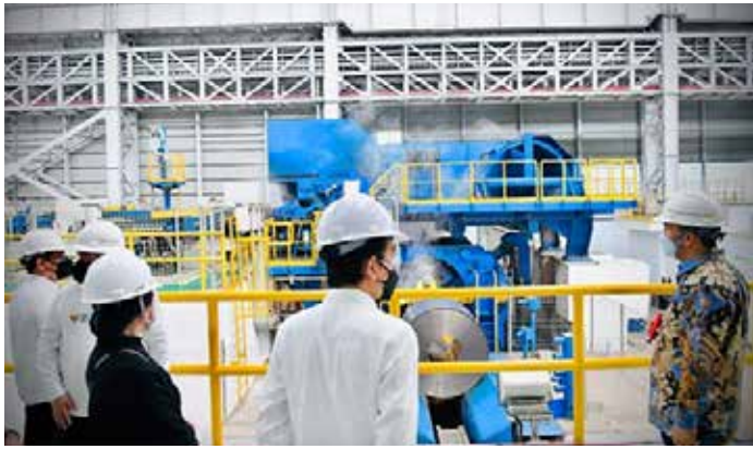
▲2021년 9월 21일 조코위 대통령이 인도네시아 국영제철소 끄라까따우 스틸의 제2 열연공장을 방문해 공장을 둘러보고 가동을 공식화했다.

인도네시아 국영제철소 끄라까따우 스틸(PT Krakatau Steel)이 끄라까따우 포스코(PT Krakatau Posco:PTKP)의 지분을 50%로 늘렸다. 이는 지난 20일 열린 임시주주총회(EGMS)에서 승인됐다고 20일 콤포스닷컴이 보도했다.