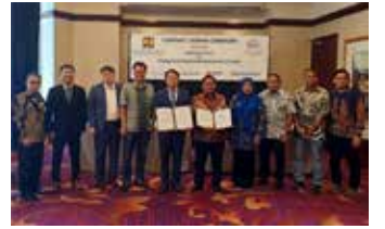
▲한국농어촌공사는 인도네시아 정부에서 발주한 ‘마헝겝 다목적댐 건설사업’에 대한 실시설계 등 컨설팅 사업 수주계약을 자카르타 현지에서 체결했다고 24일 밝혔다. (사진=농어촌공사) *재판매 및 DB 금지

한국농어촌공사는 인도네시아 정부에서 발주한 ‘마헝겝 다목적댐 건설사업’ 컨설팅 수주 계약을 자카르타 현지에서 체결했다고 24일 밝혔다. 공사는 현재 인도네시아 전역 34만8000ha에 이르는 관개 시설과 배수시스템 정비를 위한 사업 컨설팅 용역을 맡아 진행하고 있다. 올해 초 인도네시아의 수도 이전계획에 따른 식량 농업계획 및 실행계획 수립 기술자원을 위한 사