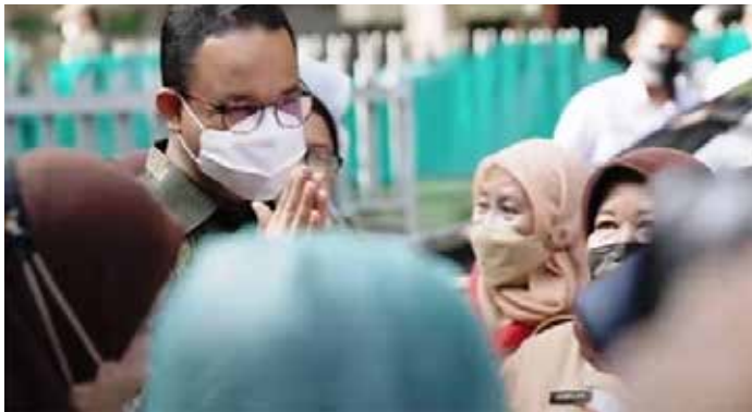
▲아니스 바스웨단 자카르타 주지사

아니스 주지사는 영입하거나 지원해야 할 핵심인물이다. 그를 지지하는 정당들은 현재 당선가능성 3위인 아니스가 반드시 대선에서 승리할 수 있도록 여러 현실적 방안들을 모색할 것이다.