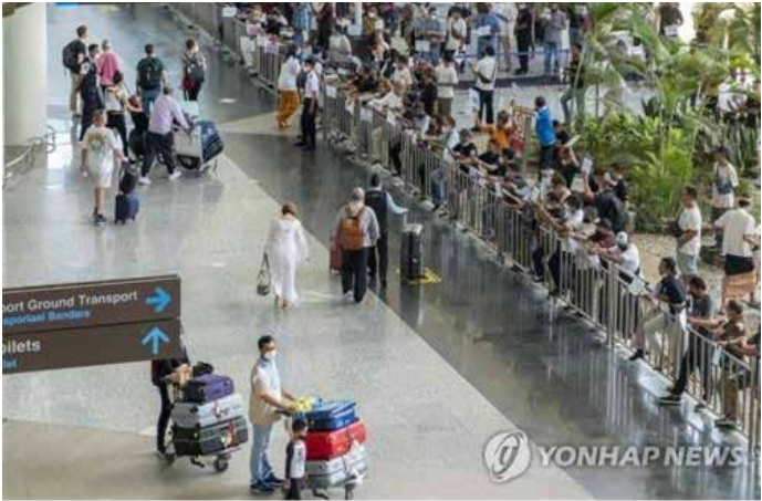
▲인도네시아 발리의 응우라라이공항 [EPA 자료사진, 재판매 및 DB금지]