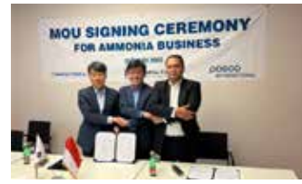
▲ 국내 최대 비료 공급사인 남해화학이 31일 암모니아 주요 공급사인 인도네시아 파르나라야(PT Parma Raya), 글로벌 트레이더인 포스코 인터내셔널사와 암모니아의 안정적인 공급을 위한 업무협약(MOU)을 체결했다.

과도 협의를 진행해 2022년도 잔여 필요물량 20천톤과 2023년도 연간 소요량의 약 70%에 달하는 90천톤의 물량 공급을 약속 받았다. 이에 따라 올해는 물론 내년