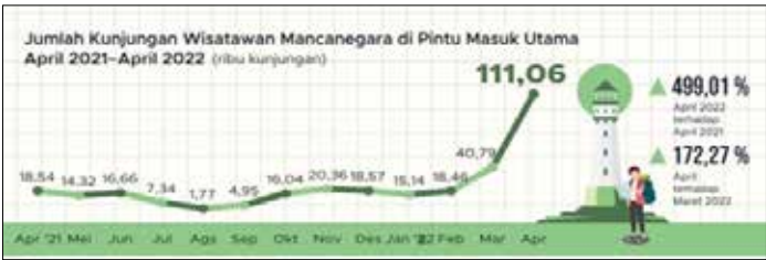
▲인니 4월 외국인 관광객, 작년 4월 대비 499.01% 급증

인도네시아가 코로나19 규제를 대폭 완화하면서 4월 외국인 관광객 수가 작년 동기 대비 5배 급증한 것으로 나타났다. 3일 안타라통신 등에 따르면 인도네시아 통계청(BPS)은 4월 인도네시아를 찾은 외국인 관광객 수가 11만1천100명으로 작년 동기 대비 499.01% 증가했다고 전날 발표했다. 이는 직전월에 비해서도 무려 172.27% 증가한 수치다. 올해 1~4월 누적 외국인 관광객 수는 18만5천440명으로, 작년 동기 대비 350% 늘었다. 자카르타의 수카르노-하타 국제공항, 발리섬 응우라라이 공항, 싱가포르와 인접한 바