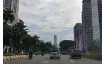
▲자카르타 시내 수디르만 도로

자카르타에서 시행되는 차량혼잡제가 기존 13개 도로에서 13개 도로를 추가하여 총 26개 도로에서 확대 시행될 예정이다.