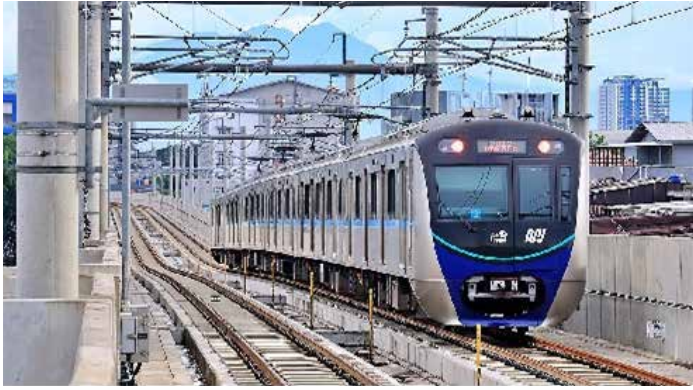
▲자카르타 르박블루스에서 호텔인도네시아까지 1단계 구간을 운행 중인 자카르타 MRT [PT MRT Jakarta]