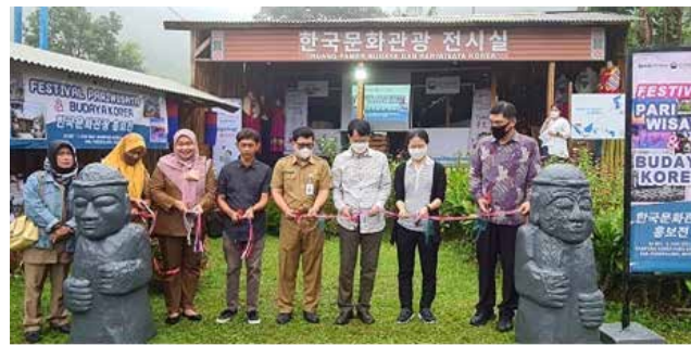
▲ 한국문화관광 홍보전 개막식

주인도네시아 한국문화원, 한국관광공사 자카르타지사와 공동으로 한국관광 사진전 및 찾아가는 한국문화 체험전까지 -