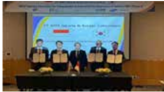
▲기념촬영하는 관계자들

한국 국가철도공단은 인도네시아 자카르타 도시철도(MRT) 4단계 사업의 공동 추진과 협력 강화를 위해 자카르타 도시철도공사(PT MRT Jakarta)와 업무협약(MOU)을 체결했다고 1일 현지 언론이 보도했다.