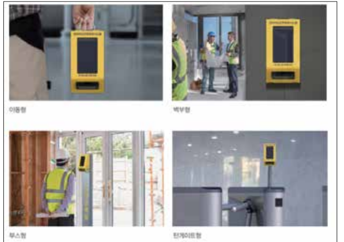
▲전자카드 지문인식 단말기의 제품 라인업.

건설현장 출입시 지문인식 통한 본인 인증 의무화 위조지문방어력 99.2% 고성능 지문인식 센서 탑재로 안전·보안성 강화