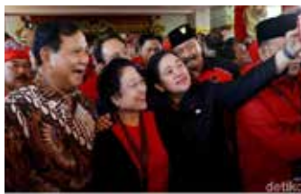
▲ 좌로부터 뿌라보워 그린드리당 총재, 메가와티 투쟁민주당 총재, 뿌안 마하라니 국회의장

2014년 대선이 3년 가량 앞두고 있는 가운데, 집권당 투쟁민주당(PDIP)의 메가와티 수카르노푸트리 총재가 자당의 대선주자 선택에 고심하고 있다.