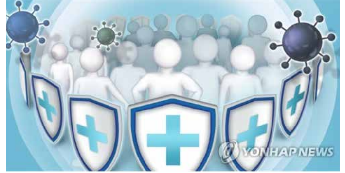
▲ 집단면역 (PG) [박은주 제작 사진합성 · 일러스트]

했다. 그는 바이러스가 지속적으로 돌연변이를 일으켜서 집단면역을 달성하기 어렵다며, 집단면역(herd immunity)보다는 집단복원력(herd resilience)을 추구해야 한다고 말했다. 무디스 애널리틱스는 인도네