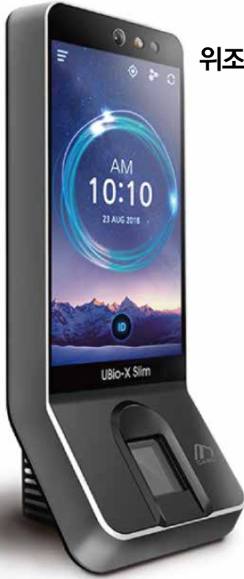
▲건설근로자공제회 지문인식 단말기-UBio-X-Slim의 모습