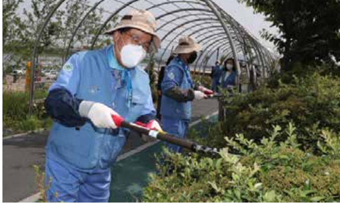
▲포스코, 전 세계 53개국 사업장서 임직원 봉사활동 포스코 최정우 회장이 1일 포항 형산강 일원에서 조경 봉사활동에 참여하고 있다. 포스코는 6월 1일부터 8일까지 8일간 포스코그룹이 진출해 있는 전 세계 53개국에서 '2021 글로벌 모범시민 워크'를 진행한다.

포스코는 1일부터 8일까지 포스코그룹이 진출해 있는 전 세계 53개국에서 '2021 글로벌 모범시민 워크'를 진행한다. 이 행사는 국내외 포스코 그룹의 전 임직원이 지역사회를 위해 다양한 나눔 활동을 펼치는 특별 봉사주간으로,