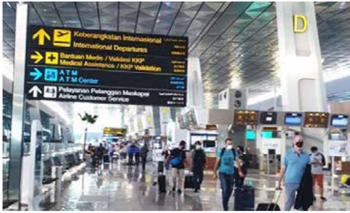
▲ 수카르노하타 국제공항 3터미널

인도네시아 정부는 코로나19 대책으로 일부 국가에서 입국한 자에 대한 격리 의무 기간을 현재 5일에서 14일로 연장하는 방안을 검토하고 있다. 코로나19 긴급대책본부의 위쿠 대변인은 4일 온라인 회견에서 “코로나19 위험 국가에서 온 여행자의 격리기간 연장을 계획하고 있다. 해외 여행자들로부터 코로나 바이러스 또는 변이 바이러스가 유입되는 것을 방지하기 위한 조치이며 곧 공식적인 결정이 있을 것”이라고 말했다. 그러나 구체적인 시기나 국가 등은 밝히지 않았다. 5일자 현지 언론에 따르면 코로나19 및 국가경제회복위원회(KPCPEN)의 수시위조노(Susiwijono Moegiarso) 비서관은 코로나19 위험 국가의 여행자에 대한 격리기간 연장은 아직 결정되지 않았으며 정부는 격리연장을 여러 국가에 적용할 필요가 있는지 논의하고 있다고 밝혔다. 현재 14일 간의 격리를 요구