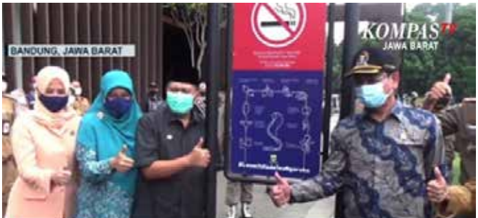
▲ 반동시 금연구역 지정(컴파스 TV 캡처)

반동시 정부는 금연 구역 KTR)에 관한 지역규정 2021 (Kawasan Tanpa Rokok : 년 4호를 지난달 31일 공식