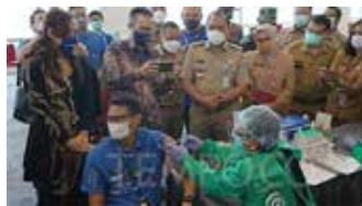
▲산디아가 우노(Sandiaga Uno) 관광창조경제부 장관은 8일 자카르타 네오 소호 센트럴 파크에서 아스트라제네카 백신 1차 접종을 받았다.

미한다고 보도했다. 코로나19 백신 접종 3단계 전에는 50세 이상, 노인 및 취약한 사람들에게 우선 순위가 있었으나 보건부는 자카르타의 코로나19 사례가 증가하고 있는 점을 고려하여 이와 같이 결정했다. 데이터에 따르면 지난 6일 일요일 기준 자카르타에서 코로나19 양성 사례는 총 435,135명에 달했으며 양성 비율은 7.62%로 자카르타에서 감염확산이 높은 편이다. 이중 35