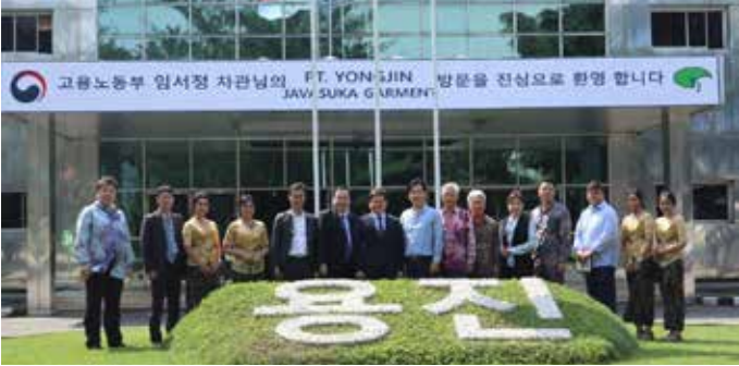
임서정 고용노동부 차관은 인도네시아 노동부 장관을 만나 상호 협력을 논의했고, 서자바주 수카부미군의 한인 봉제업체 용진을 방문해 현장 목소리를 청취했다.