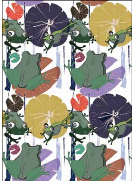
▲ 작품명 : Awkward village 박미소 작