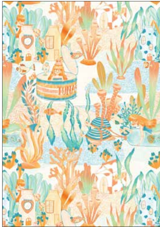
▲ 작품명 : 연밭의 빛날 옥유진 작

100여점을 50회에 걸쳐 매호 2점씩 소개합니다. 참신한 아이디어가 돋보이는 전공학생들 작품을 널리 알리는 동시에 수요 메이커에는 다양한 작품 선별의 기회를 드리겠습니다. 감사합니다. 문의·상담 : 김선희 부장 02-326-3600 *코리아 텍스타일 디자인 어워드 (Korea Textile Design Award) 출품작의 모든 디자인 저작권은 주최측(한국패션비즈니스학회·한국섬유신문)에 있습니다. 무단 도용시 민·형사상 처벌을 받을 수 있습니다. 출처 : 한국섬유신문