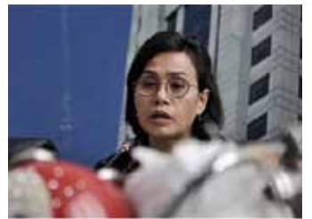
▲ 인도네시아 스리 몰야니 재무장관

한편, 재무 전문가들은 세제 감면 조치는 일시적으로 국가의 세수를 낮출 가능성이 있다고 지적했다. 법인세 인하 등 감세와 면세 조치로 인해 감