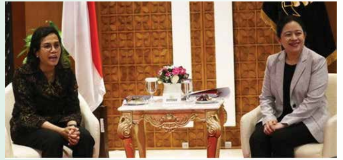
▲ 스리 몰야니 인드라와띠 재무부 장관(왼쪽)과 뿌안 마하라니 하원의장

스리 몰야니 인드라와띠(Sri Mulyani Indrawati) 인도네시아 재무부 장관은 지난 5일, 내용이 중복되는 법령을 통합한 ‘옵니버스 법’ 중 세제 관련 법안의 원안을 하원에 제출했다고 밝혔다.