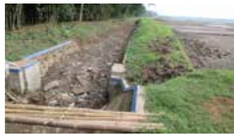
▲인도네시아 중부자바의 훼손된 논지 용수로

세계은행(WB)은 인도네시아의 관개 현대화 사업에 238억 원을 저리로 빌려주면서, 기술력이 있는 해외업체가 설계와 감독을 맡아 인도네시아 업체에 시공을 주도해 줄 것으로 기대된다. 인도네시아는 벼농사 이모작이 가능함에도 쌀 생산량이