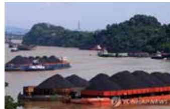
▲보르네오섬 동칼리만탄 앞바다에 떠 있는 석탄 적재 바지선

세계 최대 석탄 수출국인 인도네시아에서 석탄으로 청정연료로 알려진 DME(디메틸 에테르)를 생산하는 가스화 공장 건설이 착공됐다. 액화석유가스(LPG)와 물성이 비슷한 DME는 대량 생산하면 LPG보다 값이 저렴하고, 연료용으로 LPG와 혼합하거나 단독으로 쓸 수 있다.