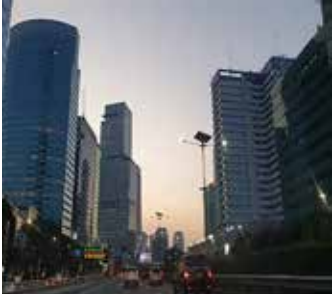
▲자카르타 시내 도로

인도네시아 사거리에서 차량들은 이제 '무조건 좌회전'을 할 수 없게 됐다.