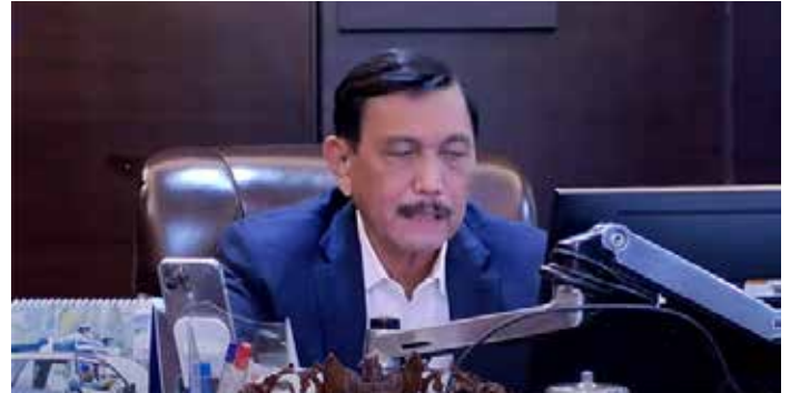
▲루훗 빈사르 판자이탄 해양투자조정장관

루훗 판자이탄 해양투자조정 장관은 자카르타 및 수도권 지역(Jabodetabek)과 족자 카르타(DIY), 발리, 반둥 지역에 대한 사회활동제한조치(PPKM) 수준을 3단계로 높인다고 발표했다. 7일 PPKM평가 온라인 기자회견에서 이같이 밝히고 이번 결정은 지난 며칠 동안 코로나19 감염 사례가 급증함에 따라 취해진 조치라고 밝혔다. 정부 데이터에 따르면, 오미크론 변이가 시작된 이래로 사망자는 357명이 발생했