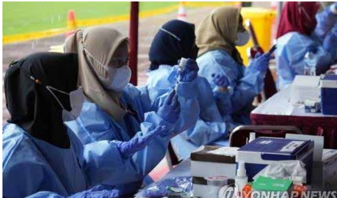
▲코로나19 백신 접종하는 인도네시아 의료진