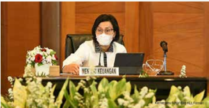
▲ 인도네시아 재무장관 스리 물리야니 인드라와띠

인도네시아 재무부는 정부가 지난해처럼 엄격한 규제를 가할 가능성이 적은 만큼 올 1분기 오미크론 변종 확산이 인도네시아 경제성장에 미치는 영향은 미미할 것으로 보고 있다고 자카르타포스트가 3일 보도했다.