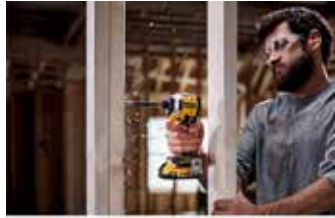
▲20V MAX 브러시리스 컴팩트 임팩트 드라이버(DCF850).