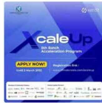
▲신한퓨처스랩 인도네시아가 현지업체 젠딧과 스케일업의 스타트업 후원사업을 시작한다.

신한퓨처스랩 인도네시아가 현지업체 젠딧(Xendit)과 스타트업 액셀러레이터 프로그램 협업 프로젝트로 엑스케일업(XcaleUp)을 선보인다.