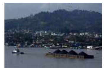
▲인도네시아 보르네오섬 이스트칼리만탄의 도시 사마린다. 견인선 한 척이 석탄을 실은 바지선을 끌고 있다. 2016년 3월 2일 촬영했다.

졌다. 자바어로 여러 섬이 모인 ‘군도’란 뜻이다. 1만7천여개의 섬으로 구성된 인도네시아의 지리적 특수성을 반영한 것으로 보인다. 현재 수도인 자카르타는 인구 1천만이 넘는 거대 도시로 세계 최고 수준의 인구 밀집도와 대기 오염으로 악명 높다. 또 도시 지반이 빠른 속도로 침하하는 것으로 알려져 오래 전부터 수도를 옮겨야 한다는 이전 논의가 있었다. 그에 따라 조코 위도도 대통령은 2019년 수도 이전을 추진하겠다는 뜻을 밝혔지만, 320억달러(38조원)에 이르는 비용 문제 때문에 선풍 나치지 못했다. 수하르소 모노아르와 실무담당 장관은 수도 이전 법안이 통과된 뒤 “새 수도는 국가 중심의 기능을 갖고 국가 정체성의 상징이 되고 새로운 경제적 중심지가 될 것”이라고 말했다. 인도네시아 정부는 수도 이전이 2022~2024년 시작된다고