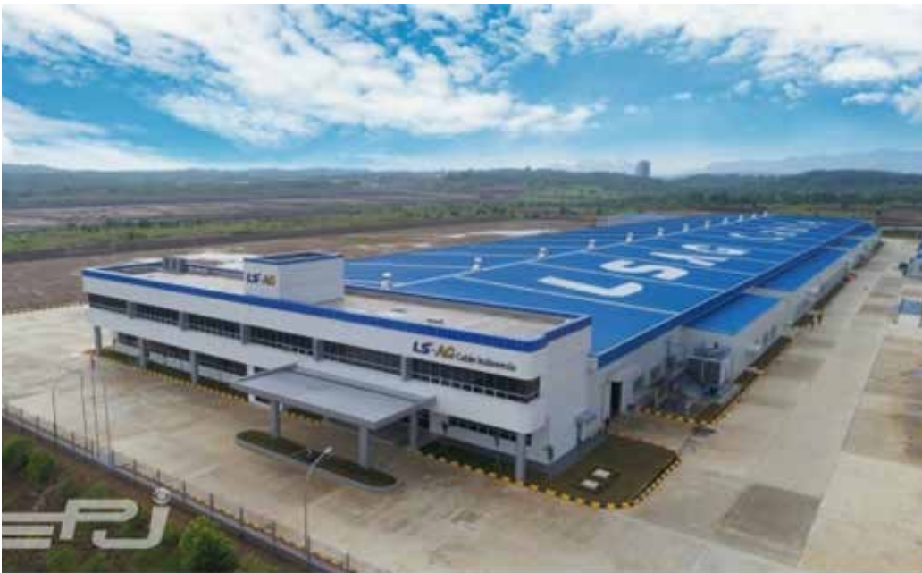
▲LS전선 인도네시아 생산법인 전경.