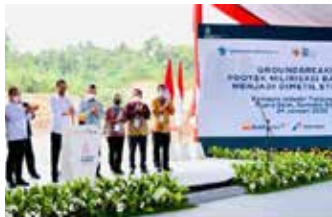
▲인니, 석탄 가스화 공장 착공...조코위 "LPG 수입 줄일 것" [인도네시아 대통령 제공, 재판매 및 DB 금지]

세계 최대 석탄 수출국인 인도네시아에서 석탄으로 청정연료로 알려진 DME(디메틸 에테르)를 생산하는 가스화 공장 건설이 착공됐다. 액화석유가스(LPG)와 물성이 비슷한 DME는 대량 생산하면 LPG보다 값이 저렴하고, 연료용으로 LPG와 혼합하거나 단독으로 쓸 수 있다.