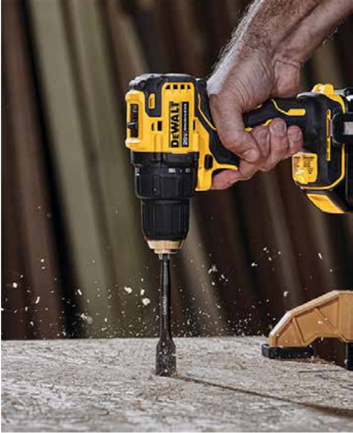
▲20V MAX XR 브러시리스 아토믹 충전 드릴 드라이버

코로나19의 확산에 따라 집 안에서 여가 및 취미생활을 보내는 사람들이 많아지면서 ‘내 집 꾸미기’ 가 나 자신을 표현하는 수단으로 각광받고 있다.