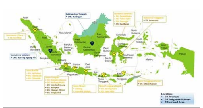
▲농어촌공사, 인니 22개 지역 총 14만3천헥타르 논지 관개 현대화(한국농어촌공사 인도네시아 사무소)

부족해 매년 쌀을 수입해야 하기에 관개 농업 인프라 개선이 최우선 과제로 꼽혔다. 농어촌공사는 독일, 인도, 파키스탄 등 6개 업체와 경쟁해 수주에 성공했다.