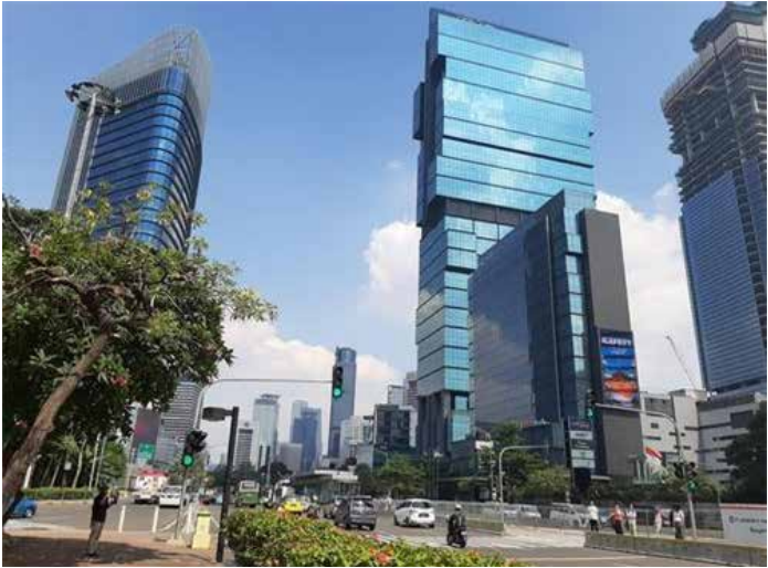
▲ 인도네시아 수도 자카르타 시내 전경

인도네시아의 지난해 경제성장률이 3.69%를 기록하면서 코로나19 사태가 처음 발생한 2020년도 마이너스 성장에서 벗어났다.